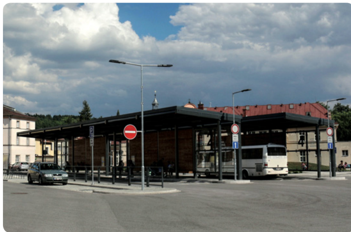
Autobusový terminál Hostinné soutěží o „STAVBU ROKU 2019“ Královéhradeckého kraje Odborná komise navštívila Hostinné 3. 9. 2019. Výsledky lze očekávat do konce roku 2019.