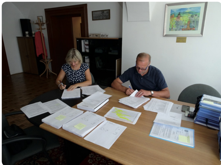
Podpis smlouvy s firmou GENEXT a. s., na Rekreační volnočasový areál Hostinné