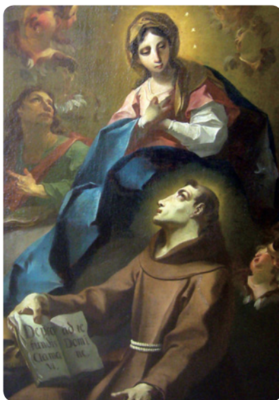
Madona se zjevuje sv. Petru z Alcantary, J.V. Bergl, olejomalba, polovina 18. století.

Na zdárném průběhu výstavy se podílí i městské muzeum sídlící ve františkánském klášteře v Hostinném. Z jeho sbírek byla do výstavní expozice ve Dvoře Králové zapůjčena Berglova olejomalba s názvem „Madona se zjevuje sv. Petru z Alcantary“ o rozměru 122 × 98 cm.