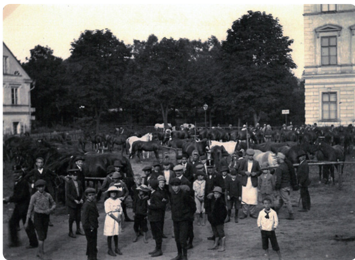
Odvod koní v Hostinném konaný roku 1914 před gymnáziem