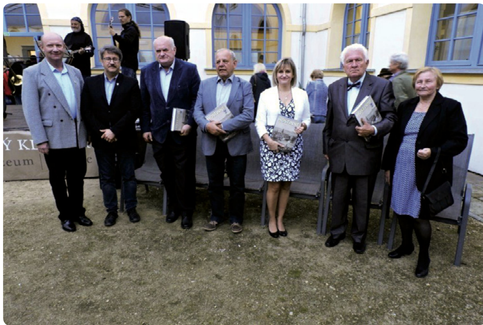
Čestní hosté na slavnostním křtu publikace o Hostinném.

připravované knihy s názvem Hostinné. Slavnosti se zúčastnili vedoucí pobočky Slezské univerzity v Opavě se sídlem