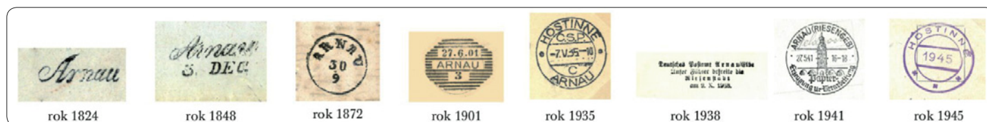
Přehled vývoje razítek poštovního úřadu v Hostinném (výběr)

(Daniel, Krtička, Fikr, Potoček, Šanda, Luštinec, Festa aj.). V prvních dnech se přijímaly pouze obyčejné a doporučené zásilky a poštovní poplatky se vybíraly hotově nebo jako doplatné. První československé známky v hodnotě 50 haléřů, 60 haléřů a 1,20 koruny byly na poštu dodány až 2. června 1945. Poštovny ve Vestřeví, Čermné a Klášterské Lhotě, které byly v provozu po dobu okupace, byly zrušeny dne 8. června 1945 a bylo zde zavedeno přespolní doručování.