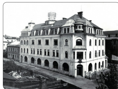
Budova nové pošty v Hostinném krátce po dostavbě v roce 1912