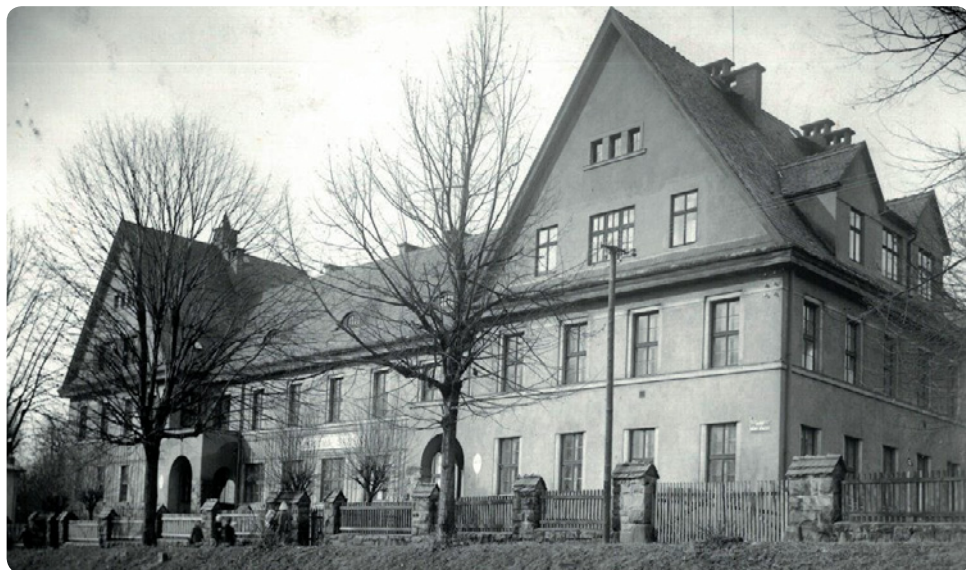
Budova bývalé III. československé devítiletky (starý městský chudobinec v ulici Boženy Němcové)