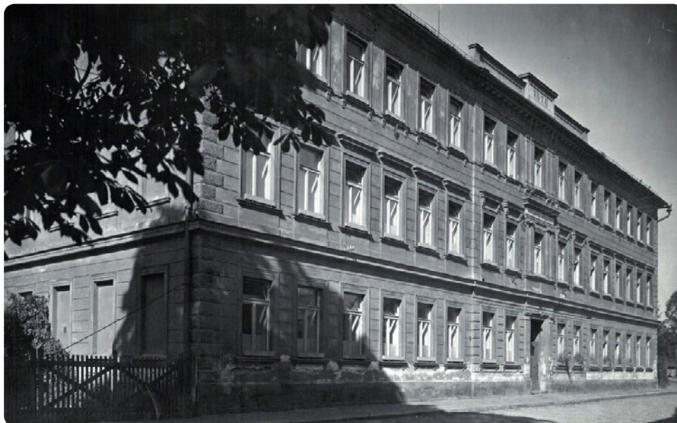
Budova bývalé II. československé devítiletky (červená škola ve Školní ulici)