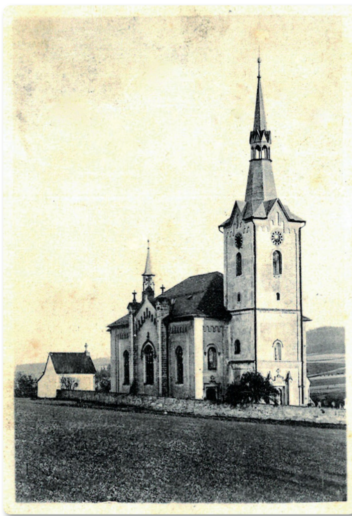
Kostel Sv. Petra a Pavla v Chotěvicích v podobě po stavební úpravě v letech 1861 - 1863

dopuštění. V té době už ve vesnici nespál snad ani jediný člověk. Všichni se strachem a se stísněnými pocity krčili pod peřinami svých postelí a ti odvážnější za okny při pozorování toho pekla venku. Náhle se krátce po půlnoci ozvala jedna mimořádně silná rána. Byl to úder od blesku, který sjel z nebe a zasáhl kostel svatě Kateřiny stojící na kopci nad Chotěvicemi. V pár okamžicích bylo vidět střechu kostela v plamenech. Než se obyvatelé vesnice v nastalém zmatku stačili shromáždit k nějaké akci, utekla pouhá čtvrt hodinka a nad obcí zapraskala další ohlušující rána. Z nebe sjel druhý blesk-žhář. Tentokrát zasáhl věž farního kostela svatých Petra a Pavla přímo v Chotěvicích a ihned ji zapálil. Tak v jednu nešťastnou noc postihla nedaleké Chotěvice taková pohroma, že zde hořely a shořely oba dva kostely najednou. Při požáru bylo v kostele sv. Petra a Pavla zničeno pět zvonů a v kostele sv. Kateřiny dva. V chotěvickém kostele se dobrovolníkům provádějícím narychlo hašení podařilo zachránit hlavní oltář, protože presbyterium hlavní lodi bylo již zaklenuto, pískaly z varhan a postranní oltář sv. Josefa. Všechno ostatní – i s krásnou kazatelnou – shořelo, protože kostel byl zakryt dřevěným stropem, který rychle prohořel. Kostel sv. Kateřiny se proměnil v popel celý.