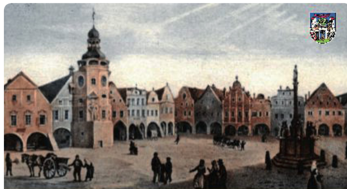
500 let od první písemné zmínky o náměstí v Hostinném 1518 - 2018