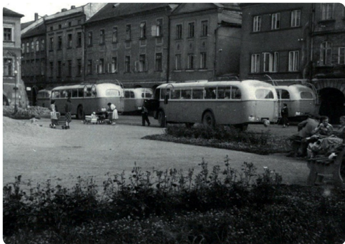
Autobusová stání na náměstí v roce 1954