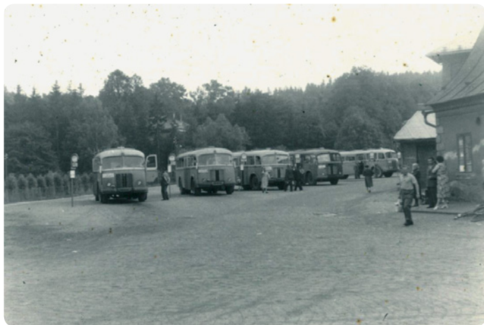
Úpravy povrchu nového autobusového nádraží v roce 1956

Vážení a milí čtenáři, snažil jsem se vám dnes tímto poněkud obsáhlejším příspěvkem z dějin města Hostinného přiblížit počátky silniční dopravy, autobusových linek, autobusového nádraží a místní provozovny ČSAD. Znovu vyhledat tyto všechny již