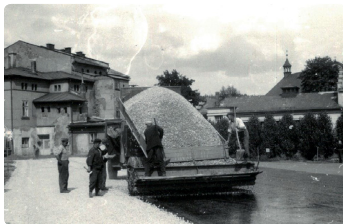
Úpravy povrchu nového autobusového nádraží v roce 1956

Jako autobusové nádraží sloužilo náměstí až do roku 1955. Z důvodu stálých stížností občanů na hluk při startování motorů v časných ranních a pozdních nočních hodinách a neblahého vlivu dopravy na fasády historických domů (praskání zdiva) bylo nádraží přemístěno na plochu v sousedství výroby sodové vody „MIRELLI“ (v loňském roce zbouraná sodovkárna č. p. 232), kde se až doposud nacházely dřevěné kůlny místních uhelných skladů se značnými zásobami uhlí. V roce 1956 se stání autobusového nádraží vrátilo zpět na náměstí z důvodu úpravy povrchu plochy u sodovkárny. Bylo zde prováděno šterkování, válcování a dvojité postřikování povrchu asfaltem. Práce trvaly 45 dní. Na ploše se nově nacházelo celkem 7 stanovišť se směrovkami: Janské Lázně – Svoboda, Vrchlabí – Rudník, Dvůr Králové, Hradec Králové, Trutnov – Nová Paka – Jičín, Vrchlabí a Čermná – Chotěvice. Dne 24. října 1956 bylo nové autobusové nádraží slavnostně uvedeno do provozu. Pro lepší celkový vzhled byly podél celé plochy směrem k papírenské škole vysázeny topoly a vybudováno zábradlí. Na tomto místě vydržel náš „autobusák“ až dodnes.