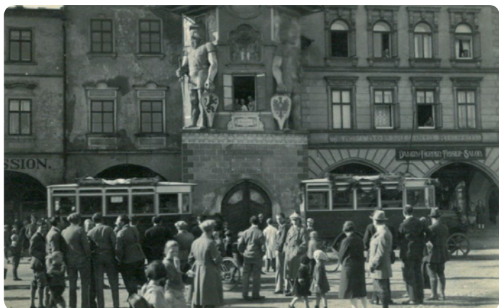
Zahájení autobusové dopravy v Hostinném roku 1928 na trase Hostinné – Černý Důl

Už je to tady!!! Hostinné má konečně svůj nový autobusový terminál. Mnozí ze starousedlíků se zpočátku zalekli tohoto honosného označení. A copak že to bude? Pro nás staromilce nic jiného než nové autobusové nádraží, které Hostinné zkrátka už potřebovalo. Vážení čtenáři a příznivci historických příspěvků Zpravodaje mi tedy laskavě prominou, že i nadále budu tento kousek území v centru Hostinného nazývat tak, jak jsem byl zvyklý odmalička a jak ho v Hostinném známe všichni, zkrátka „autobusák“. Vždyť ruku na srdce, kdo z nás jde na procházku na Hrnčířský vrch? Většina jde na „Hlíňák“. Kdo jede na Dobrou Mysl? Většina jede na „Kucmuc“. Většina z nás chodila do škol na „Soud“, „Červenku“, „Šedivku“ nebo „Boženku“. Většina ví, kde je „U Matuchů“ a kde je „U Brzáka“, a většina autobusů s výletníky vracejícími se domů do Hostinného staví „U Anděla“. A tak bych mohl pokračovat. Vědí to ti, kteří se zde narodili, kteří zde celý život žijí, kteří s městem dýchají a kteří jsou těmi pravými „Hostiňáky“. Ne však ti, kdo se za ně jen hlasitě vydávají a o městě ve skutečnosti nic nevědí.