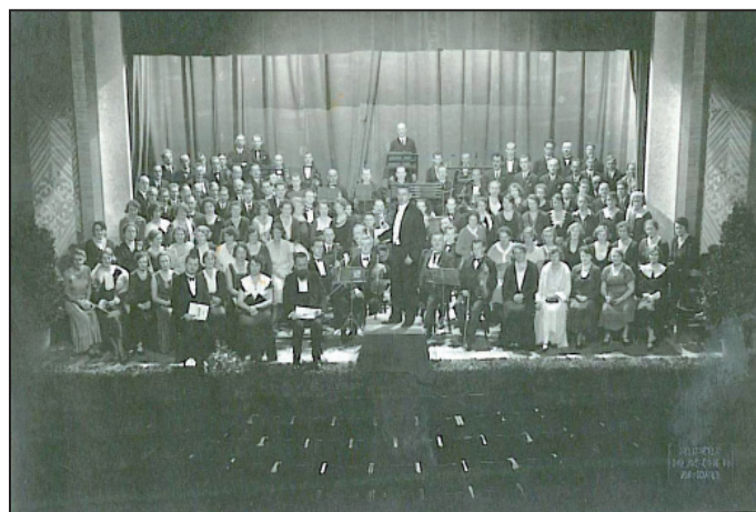
Vystoupení Krkonošského symfonického orchestru v Hostinném dne 20. října 1932 v městském kině