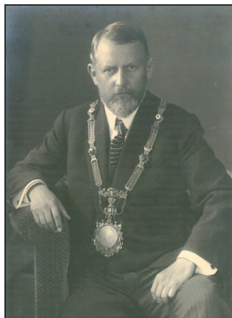
Professor dr. Emil Votoček ve 20. letech 20. století

rativní chemie. Ti, kteří psali chemii francouzsky, neobešli se bez „Slovníku česko-francouzského terminologického a frazeologického pro chemii, fyziku a vědy příbuzné“. Francouzský jazyk ovládal profesor Votoček do nejmenších odstínů a dlouho přemýšlel, jak tyto zachytit do učeb-