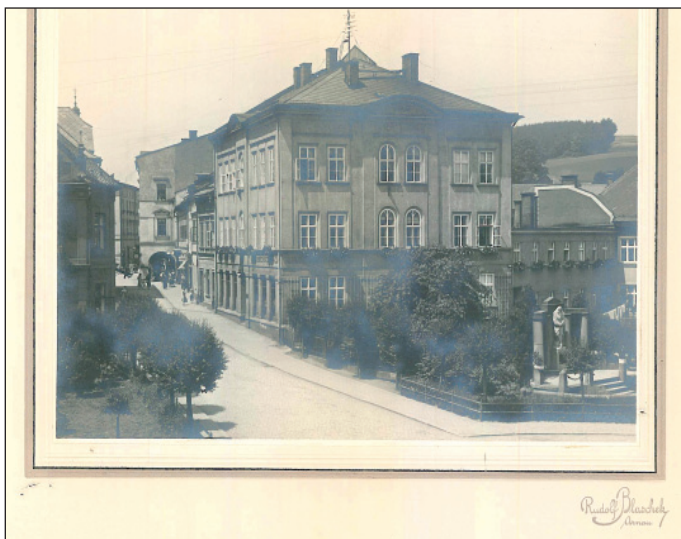
Okresní hospodářská záložna v Hostinném