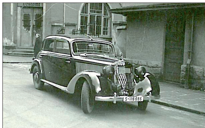
Služební vůz značky Mercedes - Benz v roce 1939