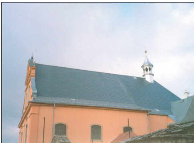
Oprava střechy Galerie antického umění