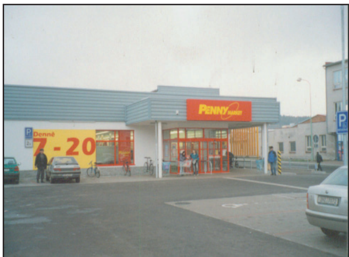
Výstavba prodejny Penny Market