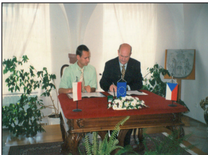
Podpis partnerské smlouvy s polským Wojcieszówem