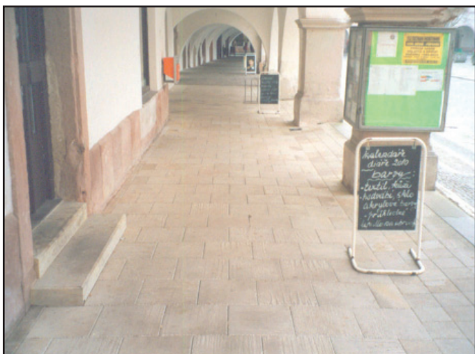
Oprava povrchu podloubí domů č. p. 36 a 37