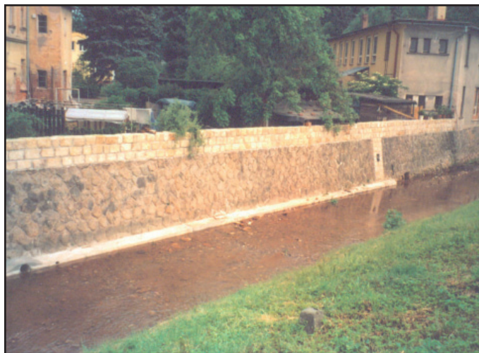
Oprava nábrežních zdí