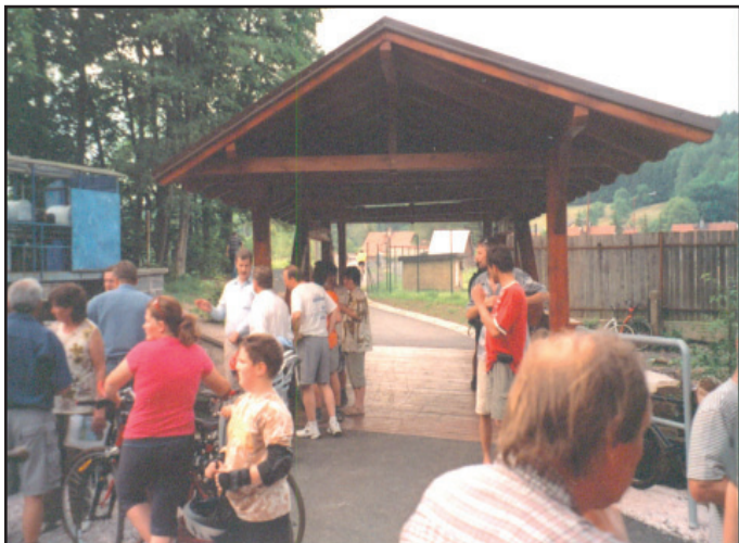
Otevření nové cyklotrasy