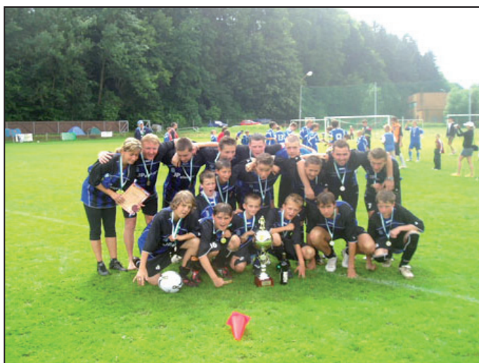
Vítěz Slavoj St. Boleslav

Pro ty, kteří rádi poslouchají pohádky, každé pondělí a středu od 9 hodin v půjčovně předčítáme.