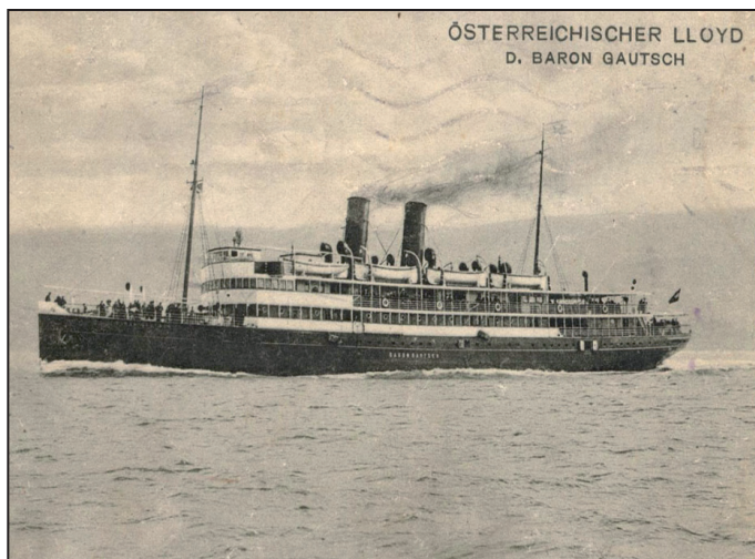
Parník Baron Gautsch