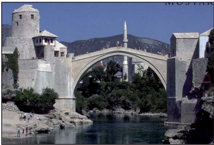
Město Mostar - poslední místo pobytu naší rodačky před tragickou smrtí