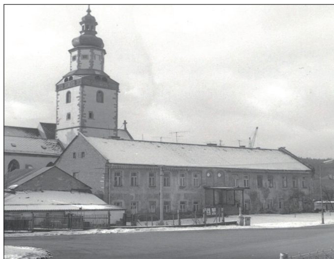
Bývalá Jezuitská rezidence v Hostinném. Zbourána v roce 1989.

Dalším důvodem k odmítnutí byla místní hostinská řeč. Nářečí, kterým se ve městě mluvilo, bylo označováno za velmi špatnou slezštinu. O výuku tohoto nářečí pro své děti v českém vnitrozemí nikdo zrovna příliš nestál. Ani poloha města na úpatí Krkonoš, kde po většinu roku bylo chladné a sychravé počasí, žáky do města nelákala. Navíc hostinský děkan odmítl jezuitům poskytnout budovu děkanství pro školní účely. Nabídl jim k používání děkanýský kostel, který však jezuité odmítli s tím, že je příliš úzký, tmavý a ve špatném stavu. Argumentovali, že nemají prostředky na jeho opravy pro své potřeby a nebo dokonce pro výstavbu kostela vlastního. Závěrem bylo konstatováno, že zřízení gymnázia v Hostinném by bylo i nekalým konkurenčním podnikem pro již dobře fungující školy v Hiršberku (Jelení Hora), Jičíně a Hradci Králové.