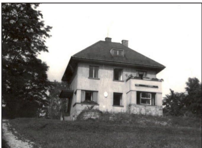
Mateřská školka okrsek č. II. na Antoníčku