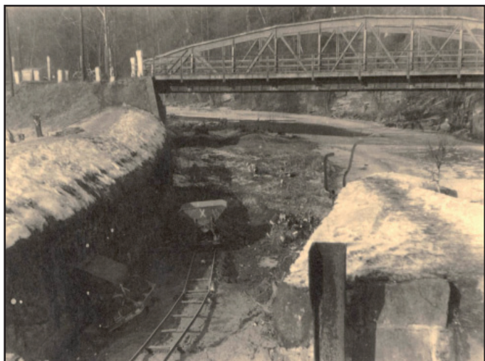
Čištění koryta Labe u Technolenu