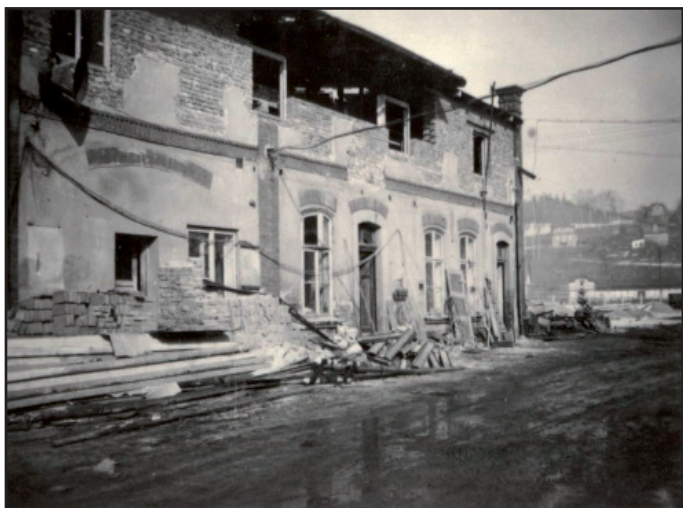
Výstavba sociálního zařízení v ČSAD