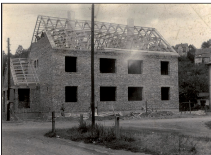
Novostavba v ulici I. Herrmanna