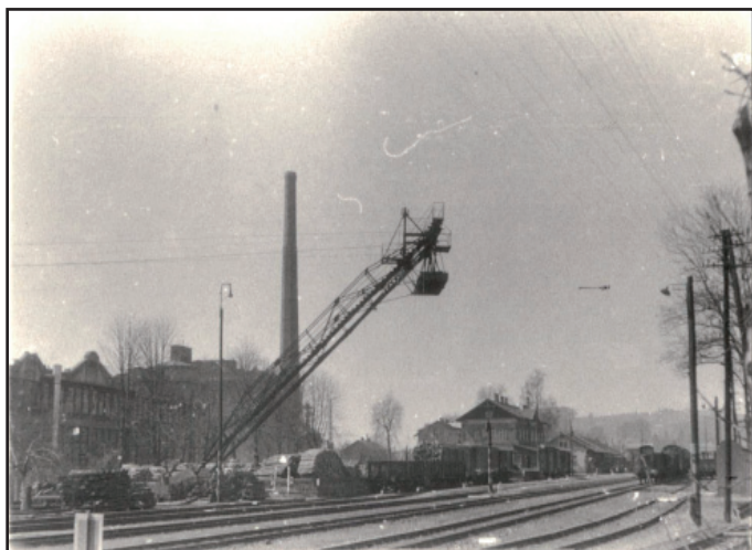
Lanovka na dopravu dřeva z nádraží do Krkonošských papíren