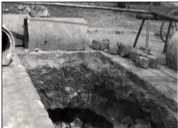
Propadlá vozovka do staré chodby u děkanství