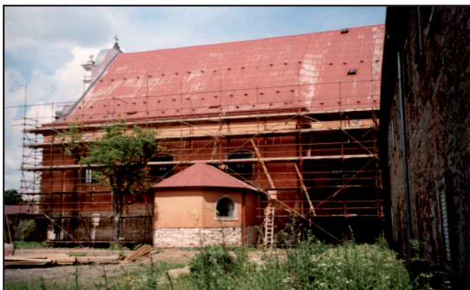
Oprava fasády Galerie antického umění