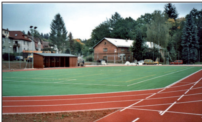
Víceúčelové sportovní hřiště