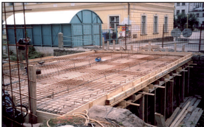
Oprava mostu u gymnázia