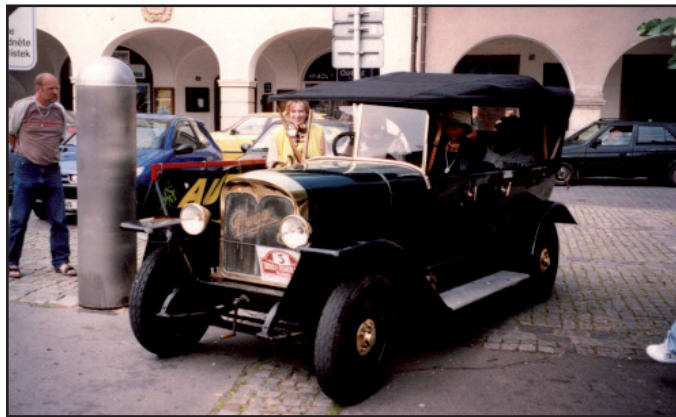
Veteran car v Hostinném