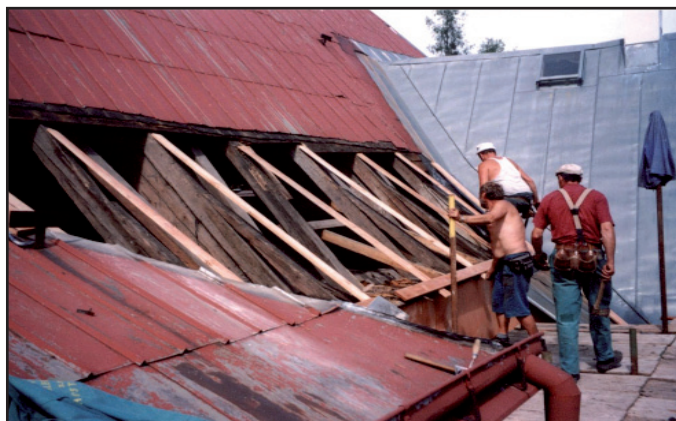
Oprava střechy Galerie antického umění