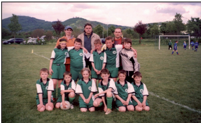
Mladí fotbalisté v Bensheimu