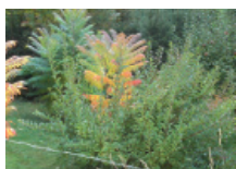
Obr. 2: Prorůstání škumpy jiným keřem. Při udržování se šíří a zabírá místo dalším rostlinám. Fotografie pochází z Hostinného, ze zahrady poblíž vlakové zastávky Hostinné město.

Dále se jedná o vlčí bob mnoholistý (Lupinus polyphyllus). Zahrádkáři ho znají pod názvem lupina (obr. 1). Rozšířil se k nám také ze Severní Ameriky. Jeho květenství, až 40 cm dlouhý hrozen, je oblíbeno mezi zahrádkáři jako řezaná květina.