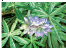
Obr. 1: Listy a květ vlčí bobu mnoholistého, který je rozšířen zejména na okrajích lesů. Zde je zachycen na kopci Poštáku v Hostinném.

rosus), známou též jako topinambura. Je to vytrvalá, slunečnici podobná rostlina dorůstající až 2,5 m. Rozšířila se k nám ze Severní Ameriky, kde se pěstuje jako okopanina. Nepotřebuje prakticky žádnou péči, je schopná přežívat i několik let bez pomoci, a dokonce se i šíří.