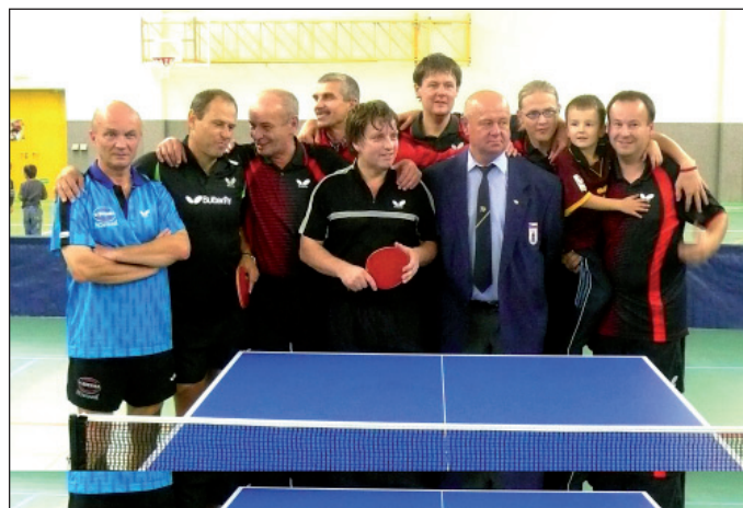
Společné foto všech aktérů exhibice