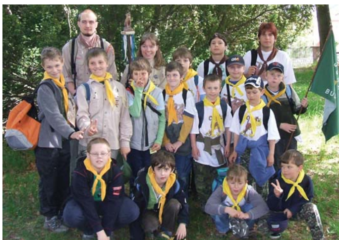
Vlčata a světlušky před závodem

Tajenku: Skaut je _____ Ů odešli spolu se jménem a věkem nejpozději do 15.6. na tel. 777 878 979