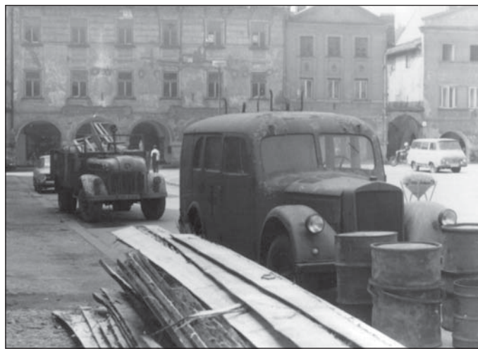
Válečná dopravní technika na Náměstí