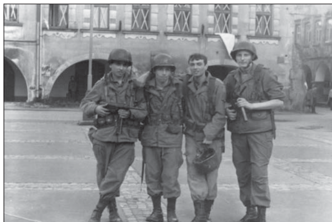
Herci z řad obyvatel města Hostinné