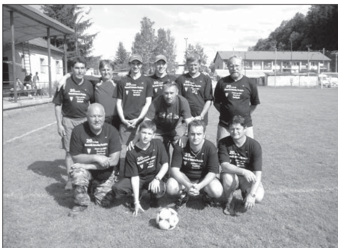
Pořadatelé na 20. ročníku: