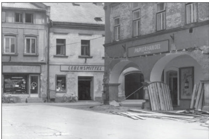
Dobové nápisy nad obchody