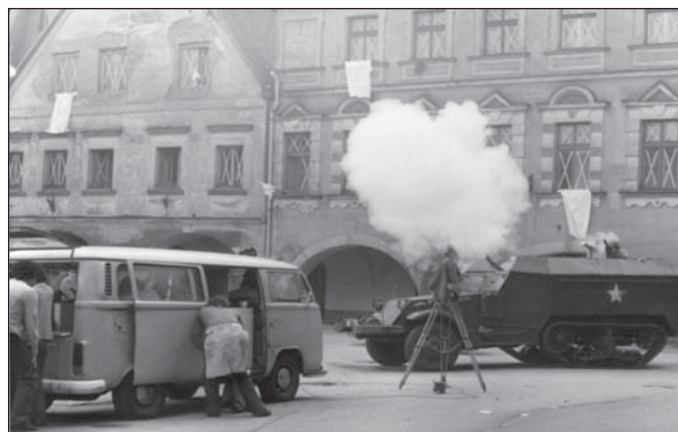
Práce kameramana na náměstí