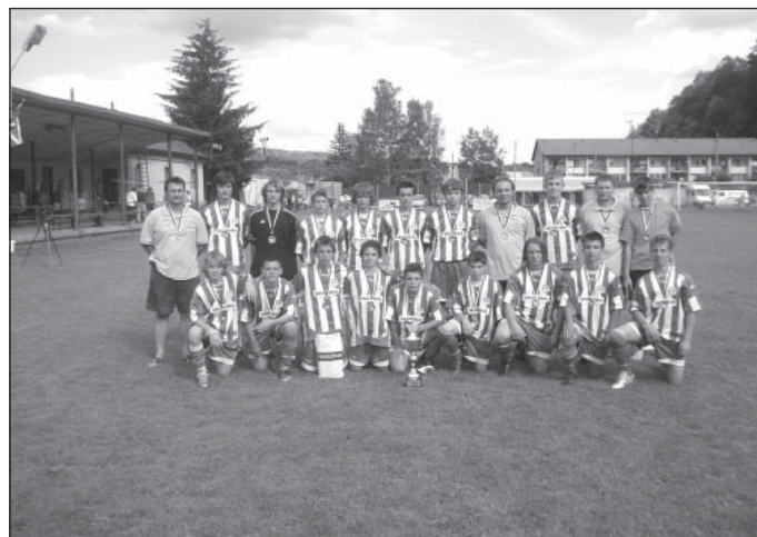
Vítěz Czech Cupu 2007 METEOR PRAHA

Neděli - druhý hrací den - otevřela další dvě čtvrtfinálová utkání. Obhájce loňského prvenství Slavoj Stará Boleslav vyřadil Jiskru Mšeno 1:0 a polský Wojcieszów překvapivě na pokutové kopy FSC Libuš 2:0! V průběhu dne se odehrála další klání o celková umístění a okolo hodiny polední to nejdůležitější – semifinále. Narazila na sebe mužstva Spartaku Rychnov a Meteoru Praha. Zápas opět na vysoké úrovni s prvky moderního fotbalu dotáhl do jednobrankového vítězství Meteor. Ve druhém porazil velmi šťastně Wojcieszów Starou Boleslav brankou v závěru a postoupil tak překvapivě do boje o zlato! O bronz si to rozdali Rychnov v. Slavoj St. Boleslav. Spartak obhájil loňské třetí místo vítězstvím 1:0 a podtrhl tak svůj sympatický projev po celý průběh Cupu. V následném finále nastoupil suverénní Meteor proti polskému překvapení. Pochybnosti o výsledku byly pouze do čtvrté minuty, kdy již Meteor vedl 2:1. Po celý další průběh již kontroloval hru a nedal soupeři šanci. Zaslouženě vyhrál 5:1 a pohár za první místo byl ve správných rukou.