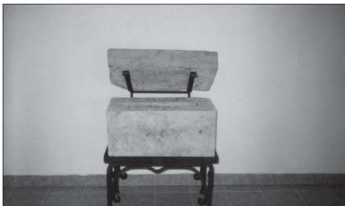
Umístění základního kamene z roku 1899 u vchodu do nové tělocvičny

Pískovcový kámen vyjmutý ze základů staré sokolovny byl řádně očištěn a ošetřen restaurátorem panem Liborem