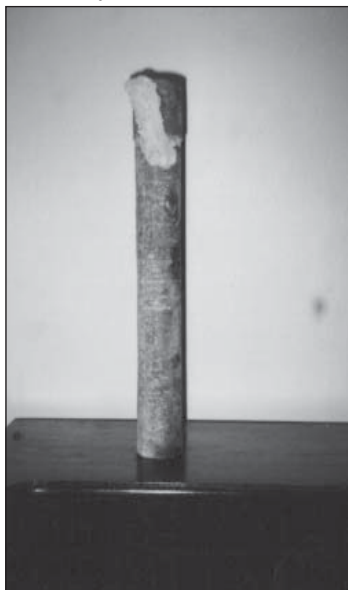
Tubus nalezený v základním kameni staré sokolovny