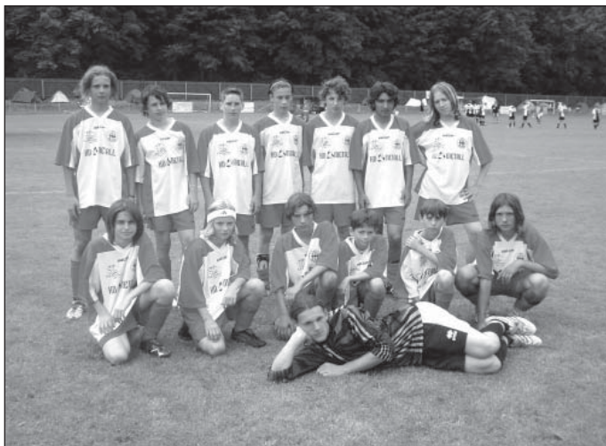
Tatran na turnaji

Celkové pořadí 20. ročníku vypadalo takto: Meteor Praha, Orzel Wojcieszów (PL), Spartak Rychnov, Slavoj Stará Boleslav, SK Jičín, Jiskra Mšeno, FSC Libuš, SKM Slávia Brno, Sk Kosmonosy, Jiskra Jaroměř a Tatran Hostinné. Velké poděkování patří všem sponzorům akce, pořadatelům, rozhodčím a těm, kteří se i malou měrou podíleli na úspěšném průběhu letošního Czech cupu v Hostinném.