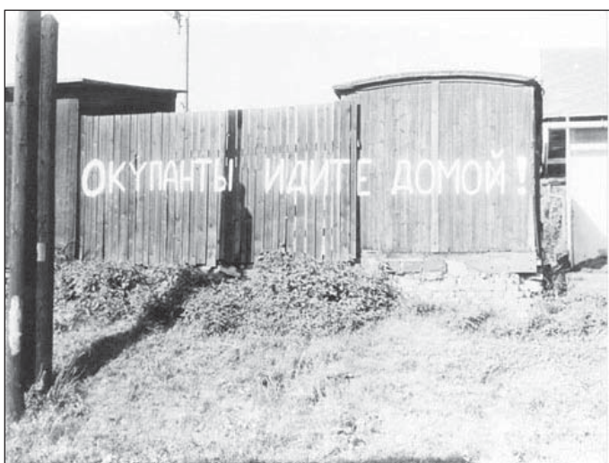
3. Nápis u nádraží