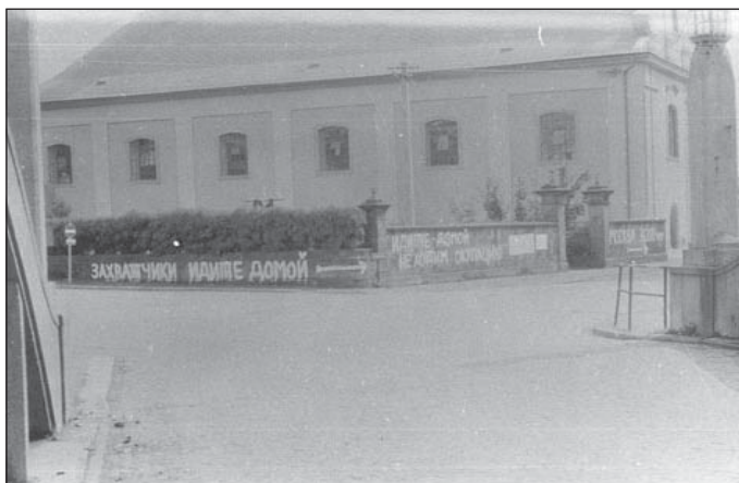
1. Nápis na hřbitovné zdi