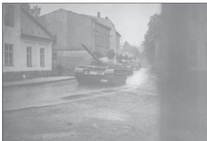
6. Okupační vojska v Hostivínské ulici