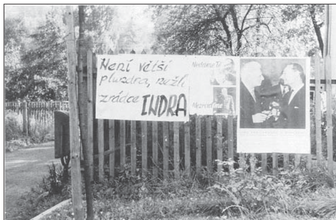
2. Plakáty na plotě u bývalé lávky přes Labe u Tatanu