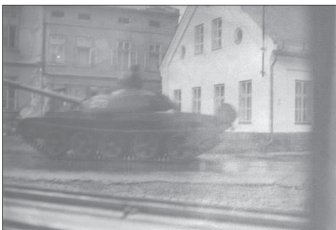
5. Tank u Národního domu