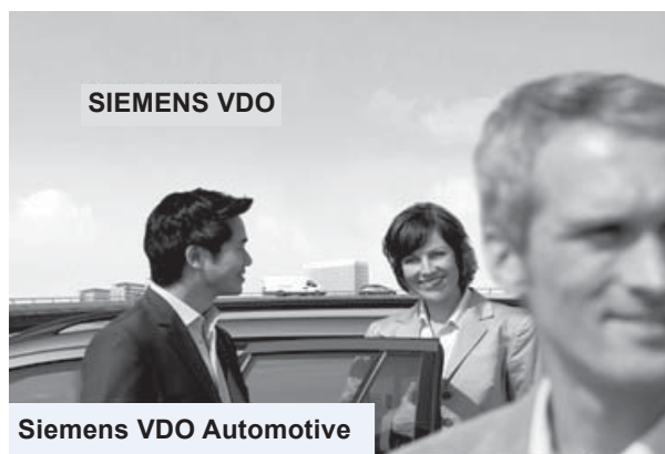
Siemens VDO Automotive

Máte-li zájem o toto pracovní místo, zašlete svůj strukturovaný životopis poštou na adresu školy nebo e-mailem na adresu ou@ouhostinne.cz do 15. června 2007.