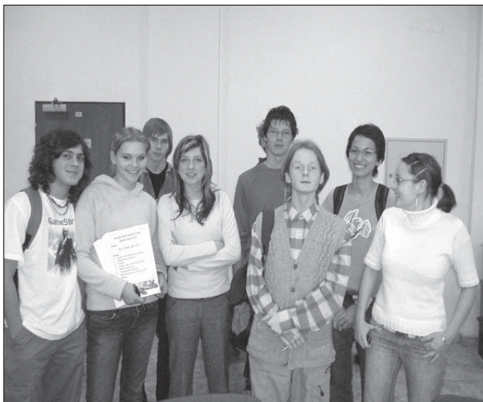
Vítězové školních kol

Zvyšující se úroveň konverzačních soutěží v německém jazyce v mikroregionu reflektuje aktuální potřebu studia jazyků a přispívá k řešení dalšího uplatnění absolventů v jejich budoucím zaměstnání. Nejde jen o pouhou komunikaci v cizím jazyce k navázání nových kontaktů s rodilými mluvčími, ale hlavně o využití cizího jazyka jako prostředku k získání informací pro budoucí zaměření studentů.