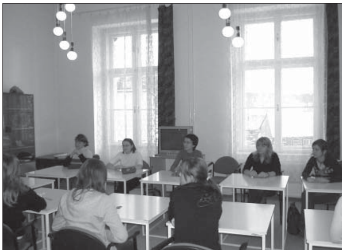
Účastníci okresního kola konverzační soutěže

V neposlední řadě je třeba poděkovat za vstřícný přístup vedení Gymnázia a SOŠ a pracovníkům DDM Jednička ve Dvoře Králové, bez jejichž finanční podpory by se okresní kolo soutěže nemohlo uskutečnit.