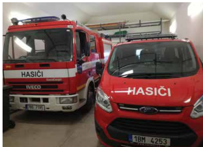
Vozový park JSDH Habrůvka, foto Z. Cihlář, únor 2018

V dubnu 2016 byla podána žádost o dotaci na Ministerstvo vnitra, Generální ředitelství hasičského záchranného sboru ČR. I přes velký počet žádostí byl náš záměr na podzim 2016 schválen k financování. Obec tak získala na pořízení nového vozidla částku 400 000 Kč! Celkové náklady se však předběžně pohybovaly na hodnotě více než dvojnásobné, a tak bez zapojení dalšího zdroje financování by zřejmě nebyl projekt realizovaný. V lednu roku 2017 byla vyhlášena Jihomoravským krajem speciální výzva /dotační oblast, která sloužila k dofinancování projektů schválených MV ČR, GŘ HZS, a to do výše 1/3 celkových nákladů. Byla to jedinečná příležitost, jak získat dodatečné finance na požární vůz. Obec Habrůvka okamžitě reagovala a podala žádost i do tohoto dotačního titulu. Podařilo se získat dalších 264 000 Kč!