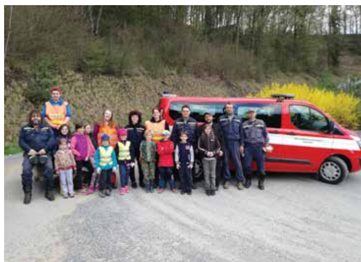
Úklid okolí cesty do Křtin, foto Z. Cihlář, duben 2018

jisté patří velký dík! Jak je již zvykem, v jarním období zajistili hasiči sběr železného šrotu a elektroodpadu. Náš sbor hasičů rovněž reprezentoval obec dne 29. 4. 2018 na tradiční letos již XVII. hasičské pouti ve Křtinách. Zde si mohli všichni prohlédnout a vidět nové dopravní požární vozidlo Ford Custom pořízené obcí Habrůvka na konci roku 2017. Zapomenout nemůže ani na organizaci tradičního „pálení čarodějnic“ na hřišti Na Stání. Na základě žádosti obce Habrůvka se hasiči rovněž podíleli, v rámci plánovaných úprav, na likvidaci a odvozu stavební sutě z přístavby budovy obecní budovy č. p. 99 (Janus/Trnečka). Dětský den byl v letošním roce hasiči uspořádán jako celodenní výlet do dětského přírodního areálu Vagón Polnička, kde si děti i dospělí užívali všech nabízených atrakcí. Dne 9. 6. 2018 hasiči uspořádali tradiční taneční zábavu ve stylu country, kdy k poslechu a tanci hrála již dobře známá skupina Rančeři. Další akcí byla taneční zábava se skupinou Eminence Rock dne 7. 7. 2018. Zástupci sboru také reprezentovali habrovské hasiče na největším setkání požárních automobilů v ČR na akci zvané PYROCAR ve dnech 16–18. 8. 2018. Členové SDH Habrůvka se také podíleli na