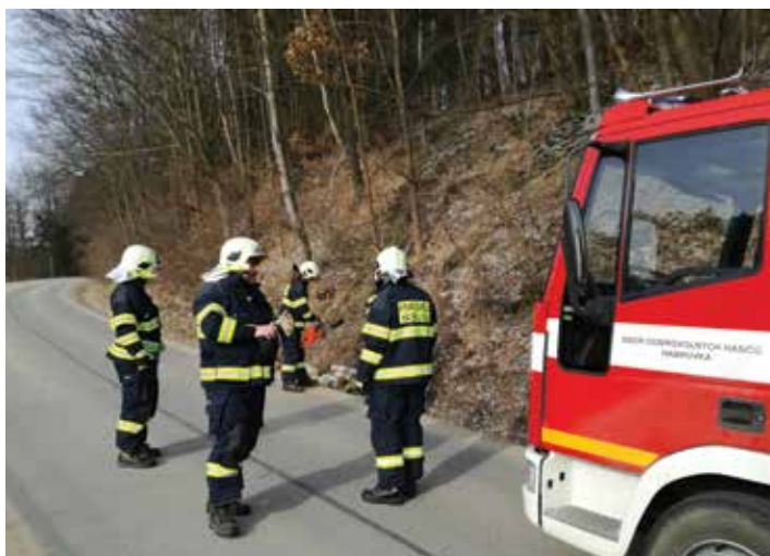
Technická pomoc – odstranění stromu přes cestu, foto Z. Cihlář, březen 2018

jisté patří velký dík! Jak je již zvykem, v jarním období zajistili hasiči sběr železného šrotu a elektroodpadu. Náš sbor hasičů rovněž reprezentoval obec dne 29. 4. 2018 na tradiční letos již XVII. hasičské pouti ve Křtinách. Zde si mohli všichni prohlédnout a vidět nové dopravní požární vozidlo Ford Custom pořízené obcí Habrůvka na konci roku 2017. Zapomenout nemůže ani na organizaci tradičního „pálení čarodějnic“ na hřišti Na Stání. Na základě žádosti obce Habrůvka se hasiči rovněž podíleli, v rámci plánovaných úprav, na likvidaci a odvozu stavební sutě z přístavby budovy obecní budovy č. p. 99 (Janus/Trnečka). Dětský den byl v letošním roce hasiči uspořádán jako celodenní výlet do dětského přírodního areálu Vagón Polnička, kde si děti i dospělí užívali všech nabízených atrakcí. Dne 9. 6. 2018 hasiči uspořádali tradiční taneční zábavu ve stylu country, kdy k poslechu a tanci hrála již dobře známá skupina Rančeři. Další akcí byla taneční zábava se skupinou Eminence Rock dne 7. 7. 2018. Zástupci sboru také reprezentovali habrovské hasiče na největším setkání požárních automobilů v ČR na akci zvané PYROCAR ve dnech 16–18. 8. 2018. Členové SDH Habrůvka se také podíleli na