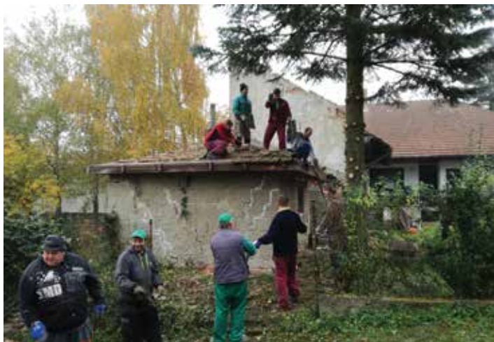
Práce při bourání hospodářského stavení, říjen 2017

V letošním roce se SDH Habrůvka podílel na organizování mnoha kulturně-sportovních akcí. Jednou z prvních událostí bylo uspořádání zájezdu do termálních lázní Velký Meder dne 17. 3. 2018. Všichni měli možnost zrelaxovat svoje těla a užívat nabídky slovenského lázeňského komplexu. SDH Habrůvka se letos již popáté zapojil dne 13. 4. 2018 do akce „Úklid Moravského krasu“. V rámci činnosti s mládeží hasiči opět vyčistili od odpadků okolí příjezdové cesty Habrůvka-Křtiny. Za tuto veřejně prospěšnou činnost jim za-