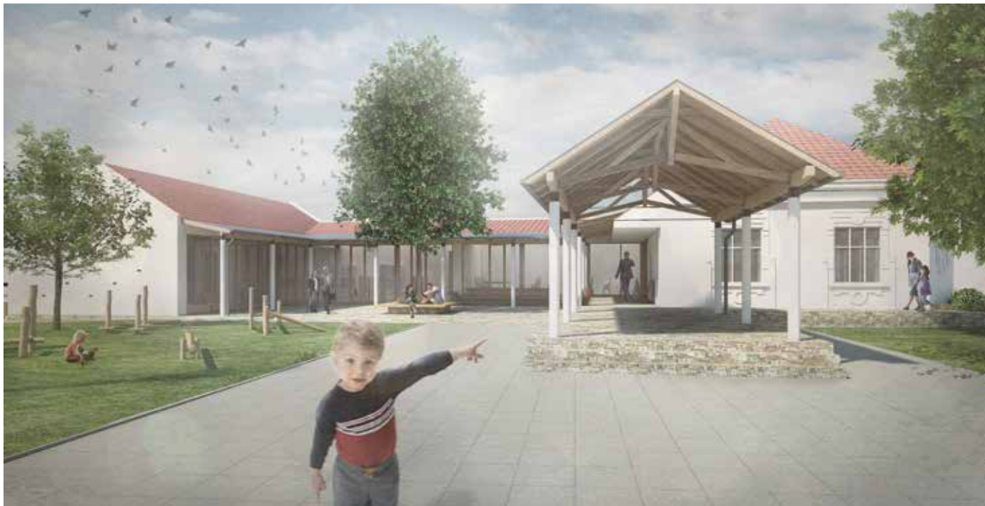
Vizualizace nového náměstí