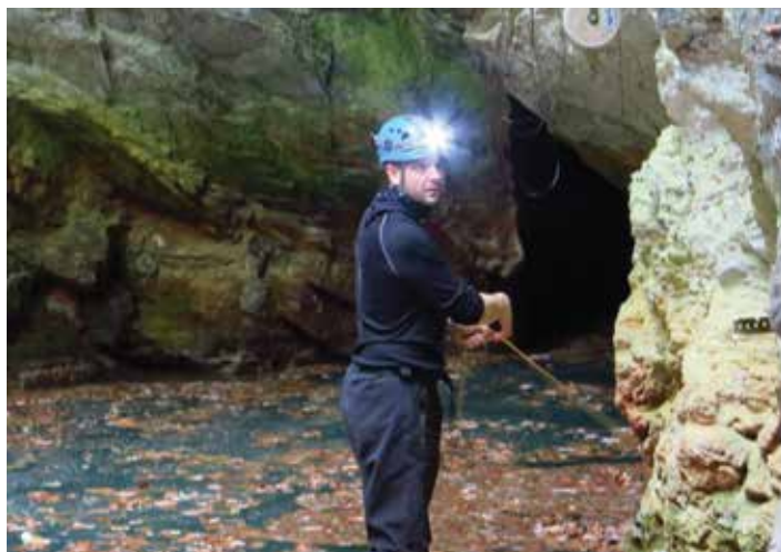
Nový světový rekord – Hranická propast

V úterý 27. září 2016 odpoledne se robot česko-polské expedice dostal do neuvěřitelné hloubky 404 m pod hladinou minerální vody, ale šachta propasti stále padala níž a níž! Hranická propast na Přerovsku se tak stala nejhlubší zatopenou jeskyní na světě. Dosaďovací rekord držela italská propast Pozzo del Merro s naměřenou hloubkou 392 metrů. Speleologové zkoumají hloubku Hranické propasti již řadu let a hranice postupně posunují. Před dvěma lety zde potápěč Krysztóf Starnawski za pomoci sondy naměřil hloubku 384 metrů, těsně pod hranicí italské jeskyně. Loni sestoupil do rekordní hloubky neuvěřitelných 265 metrů a letos s pomocí dálkově řízeného robota vytvořil světový rekord. Zdálo by se, že je tato senze a zcela ojedinělá zpráva světového významu naprosto mimo