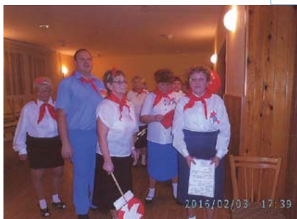
Maškarní bál 2016