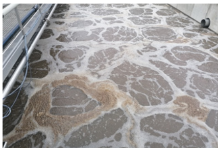
Drnovice jsou již napojeny na novou část ČOV.