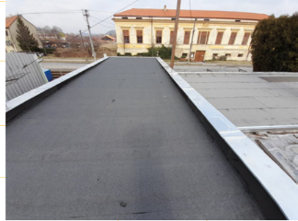
Střecha nad zahradnictvím.

Komunikace v majetku SUS JMK: Spolupráci s SUS JMK se dlouhá léta nedařila navázat, proto jsem ráda, že se ledy prolomily a díky tomu opravíme opěrnou zeď a chodník spolu s komunikací u křižovatky Lysice-Kunštát (duben-květen). Oprava výtluků a nerovností na komunikaci ve směru do obce byla