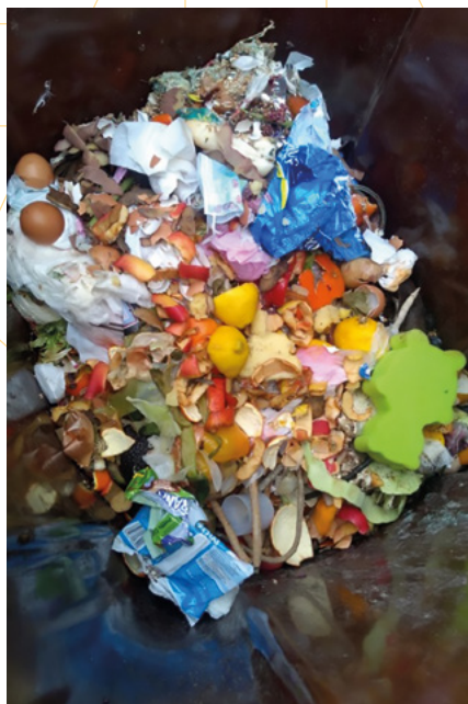
Sáček špatně! Dětské plínky, sáčky a jiný směsný odpad... celé špatně!

Co to znamená pro občany a obec? Obci se tak zvýšil podíl směsného odpadu, za který je vysoká úhrada skládce i státu na poplatcích. S čistým bioodpadem by platila polovinu na kompostárnu a kompost by pak byl využitý do půdy. A obec by si zvýšila procenta