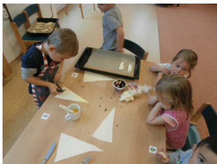
Pečeme svatomartinské rohlíčky.