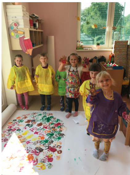
Tvoření v MŠ.

činnost plnily na 100 %, samozřejmě i s ohledem na vzniklá aktuální corona-virová opatření.