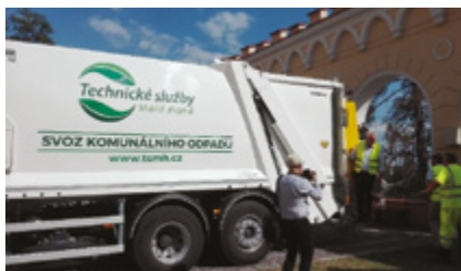
Auta s vážícím systémem

a má právo rozhodovat při hlasování jedním hlasem. Vzhledem ke zvyšování poplatků za svoz komunálního odpadu, budeme žádat o dotace pro systém „door to door“ z JMK. Obce, které nebudou dostatečně třídit, zaplatí v budoucnu za jednu tunu komunálního odpadu (černé popelnice) až trojnásobek současné ceny. V roce 2030 mají být podle zákona skládky zrušeny úplně. Veškeré podrobné informace občanům poskytneme formou prezentace a diskuse v Lidovém domě. Termín bude včas sdělen.