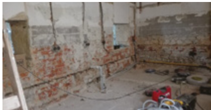
Kuchyň a třída

Největší stavební úpravy probíhají v přízemí ZŠ . Naše obec jako jedna ze tří obcí JMK získala letos v květnu dotaci z Ministerstva financí na projekt v hodnotě cca 6 000 000 Kč se spoluúčastí