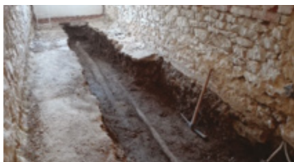
Šatna a chodba

obce. Přestavba započala ve třídě v přízemí a v šatně. Dojde k rekonstrukci jídelny a kanalizačního připojení. Paní kuchařky budou mít kompletně novou kuchyň se vzduchotechnikou a novými elektrospotřebiči. Na děti bude čekat nové