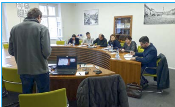
Přehled projektů IROP ve fyzické realizaci

odborných učeben, pořízení pomůcek do vyučování, stavební práce atd.). Do výzvy přihlásilo projektů celkem 5 žadatelů: VOŠ a SŠ Boskovice, ZŠ Lomnice, město Olešnice, obec Voděradý a SŠ André Citroëna Boskovice . Výzva byla vyhlášena s celkovou alokací 20,4 mil. Kč (z toho dotace 19,4 mil. Kč). Žadatelé však požadovali dohromady dotaci ve výši 23,7 mil. Kč. Formálním hodnocením prošly všechny projekty. Na základě věcného (bodového) objektivního hodnocení byly projekty seřazeny dle počtu získaných bodů (viz tabulka níže). Vzhledem k tomu, že výzva č. 6 „Bezpečnost