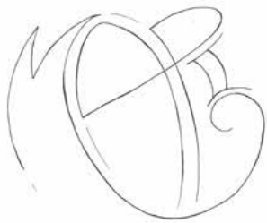
Vojtěch Trmač, 15 let ZŠ a MŠ Olešnice