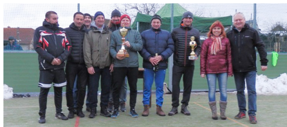
Vítězné družstvo – Staří páni