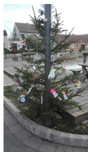
Děti zdobily svými výrobky stromečky na návsi.