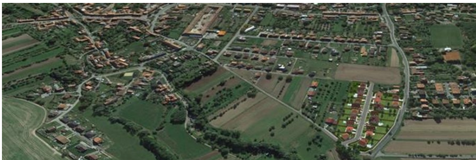
Ilustrační foto, neodpovídá finální parcelaci