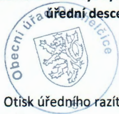
Otisk úředního razítka

Tento dokument musí být vyvěšen na úřední desce po dobu 15 dnů. Patnáctý den vyvěšení na úřední desce Obecního úřadu Drahelčice je dnem doručení.