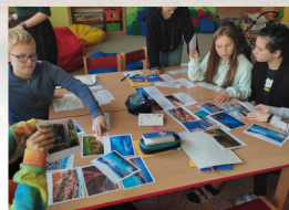
informace ze školy str. 7.