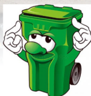
odpady str. 6.