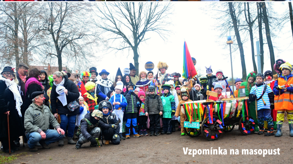
Vzpomínka na masopust