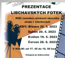
kultura str. 3.