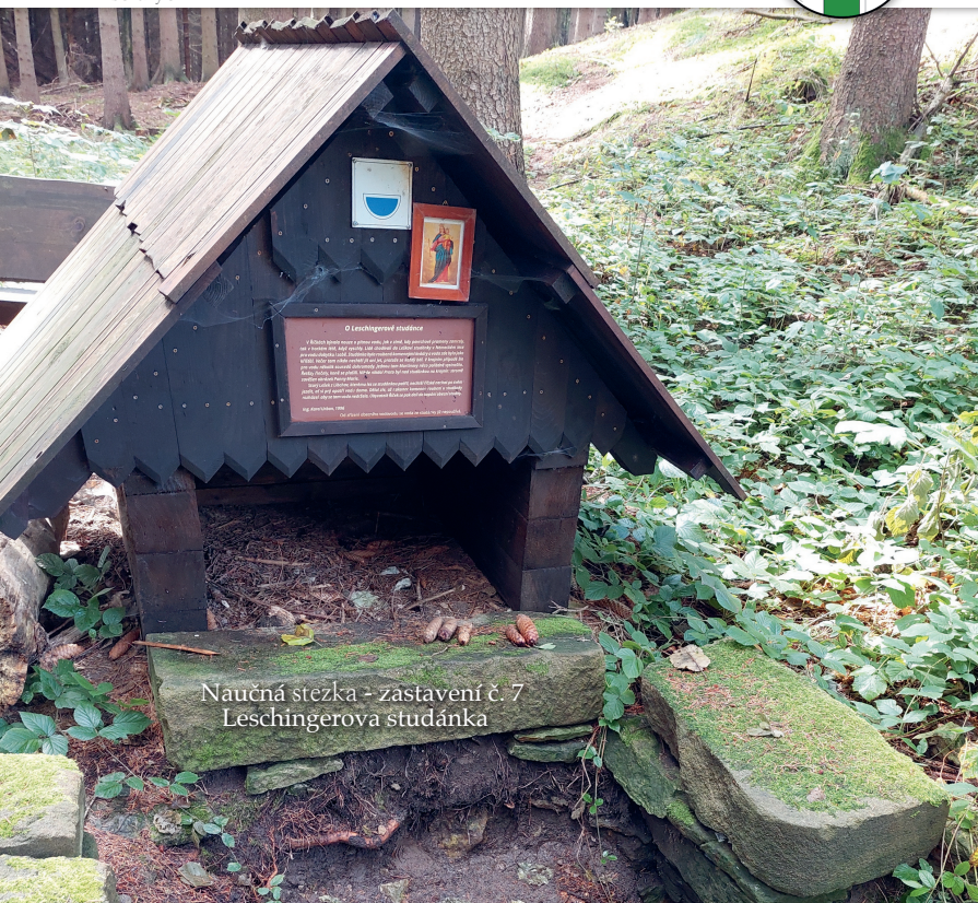
Naučná stezka - zastavení č. 7 Leschingerova studánka