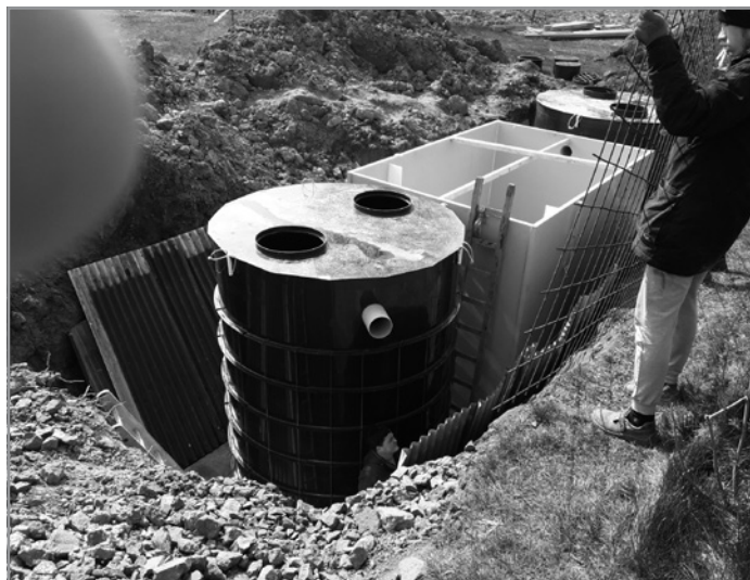
ODKANALIZOVÁNÍ OBECNÍCH BUDOV – Usazené komory nové čističky.