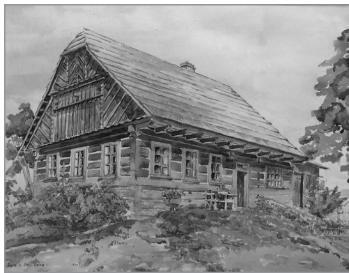
Stará škola v Dolní Kalné na akvarelu Miroslava Drahoňovského.

Úbytek dětí po světové válce způsobil redukci školy na školu trojtřídní.