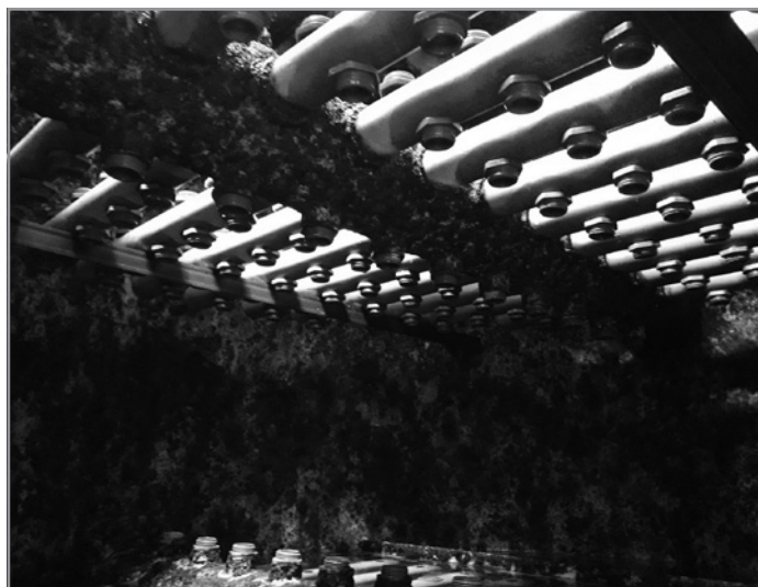
ČIŠTĚNÍ FILTRACE NA KOUPALIŠTI Demontovné trysky ve filtračních nádobách.