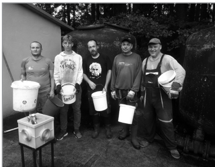
ČIŠTĚNÍ FILTRACE NA KOUPALIŠTI Kbelíková brigáda - za tři hodinky přemístěno devět kubíků písku.