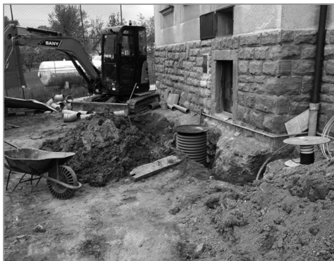
ODKANALIZOVÁNÍ OBECNÍCH BUDOV – Úpravy napojení vývodů ze sokolovny.