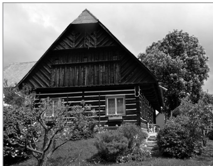
Stavení staré školy v Dolní Kalné dnes.