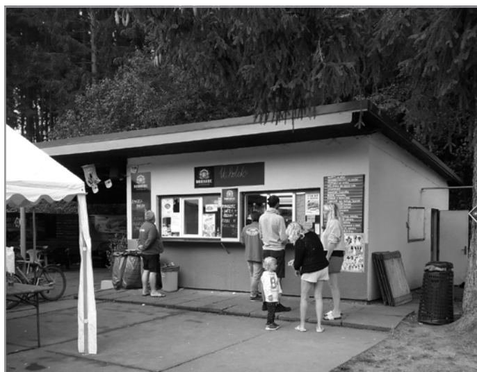
SEZONA NA KOUPALIŠTI Kiosek u potoka půjde v září k zemi a na jeho místě vyroste nový, větší a modernější.