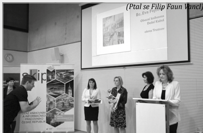
(Ptal se Filip Faun Vancí)

A velkým téměř vánočním dárkem budou audioknihy, které se u nás v knihovně objeví k vypůjčení. Které to budou? Necháme se překvapit, poskytnuty nám budou v rámci výměnného souboru z Trutnova. Určitě mezi nimi budou i atraktivní novinky."