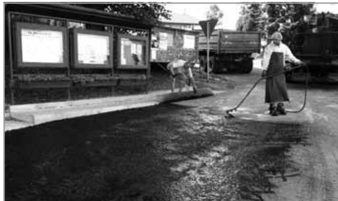
Úprava parkoviště před vývěskami pod kostelem