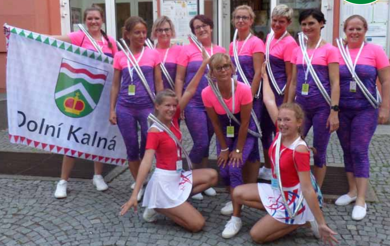
Dolnokalenské účastnice XVI. všesokolského sletu v Praze 1. – 6. 7. 2018