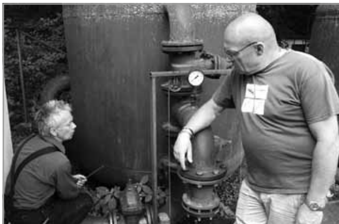
Oprava čističky na koupališti