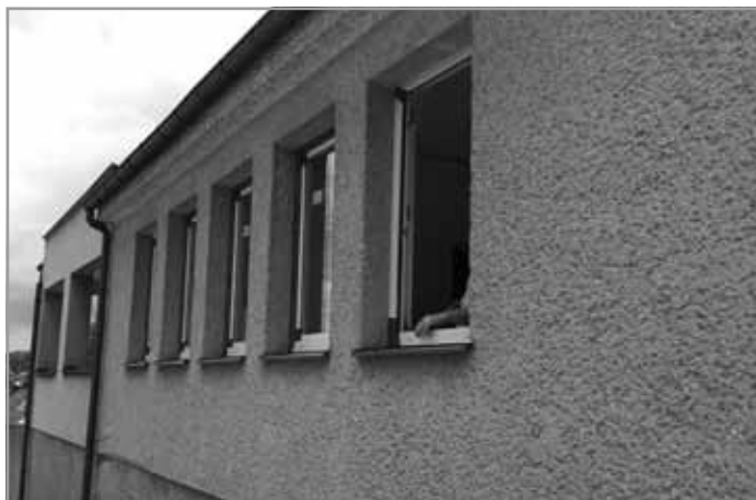
Výměna oken v obřadní síni