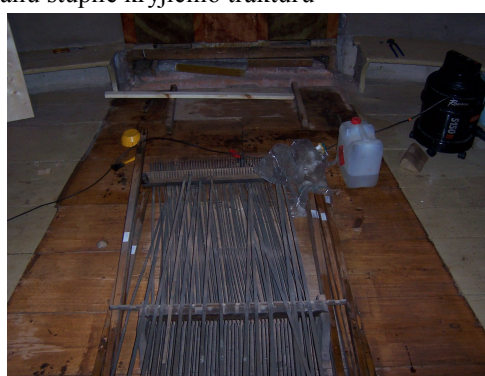
Čištění podlahy od šelaku zpevněného prachu