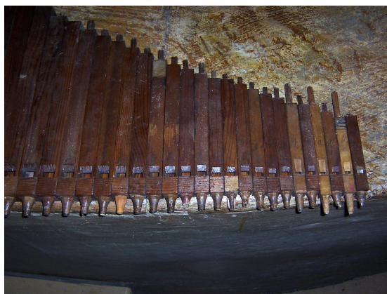
Píšťaly Kopuly 8' zatřeny šelakem

Nejprve bylo nutné odstranit šelakový nátěr. Píšťaly byly ponechány působení par lihového ředidla v uzavřeném prostoru, kde došlo k naleptání a změkčení šelaku, který byl následně odstraněn odmytím v lihovém ředidle. Po odstranění šelaku a vyschnutí rozpouštědla následoval nátěr konzervační látkou – roztokem lignofixu v technickém benzínu a lihovém ředidle. Po vyschnutí rozpouštědla byla provedena petrifikace ponořením do Solakrylu BMX ředěného toluenem. Po důkladném prostoupení látky materiálem byly píšťaly vyjmuty z lázně, přebytečný Solakryl byl z povrchu odstraněn a píšťaly byly uskladněny, aby mohlo dojít k vysušení rozpouštědla a vytvrdnutí petrifikační hmoty. Následně došlo k truhlářským úpravám: vysazení materiálu na lábiích, zátkách, byly zhotoveny repliky poškozených a zničených noh, předkrývek případně jader. Nevratně zničené nebo nevhodné v minulosti doplněné píšťaly byly nahrazeny stylovými replikami. Korpusy píšťal, které byly popraskané a rozklížené, byly opětovně slepeny za pomoci kostního kliču. Píšťaly byly sesazeny, předintonovány a usazeny na píšťalnici.