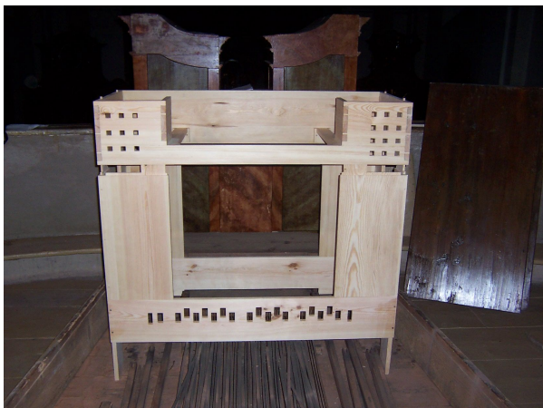
Usazení skeletu hracího stolu

Pod registraturu byla viditelně umístěna samolepka s logem KHK.