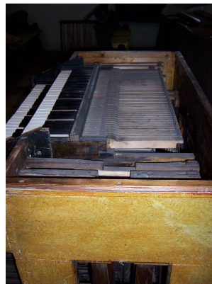
staré nestylové klaviatury