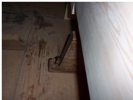
montáž ložiska traktury - sbíjení kovanými hřebíky