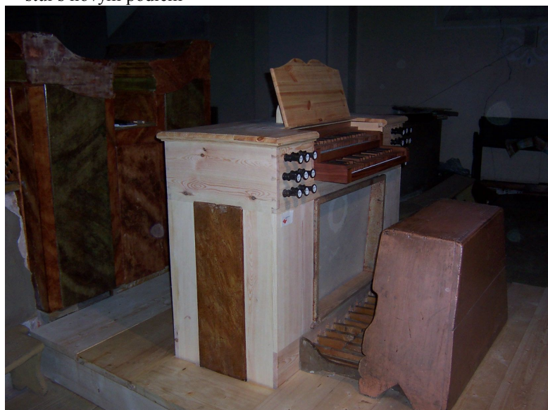
◀ ▲ Celkový pohled na dokončenou etapu.