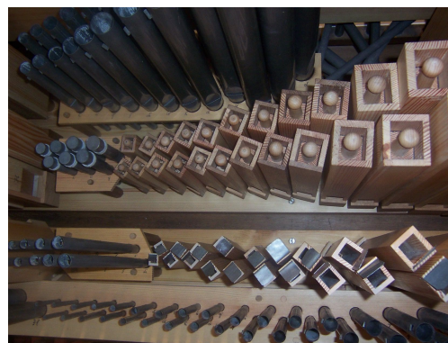
detailní pohled na sesazené píšťaliště Cis strana