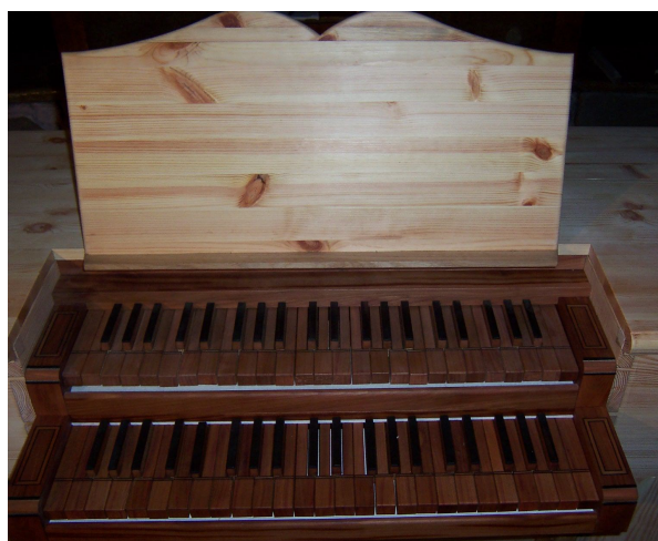
celkový pohled na klaviatury a notový pult