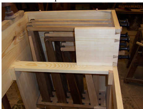
původní rejstříkové ovládání v novém skeletu