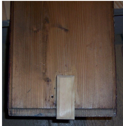
doplněný zámek výplně, výplň bez vrstvy šelaku, zbytků tmelu, konzervovaná a petrifikovaná