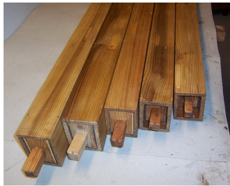
Kopula 8 e po restaurování- pohled na zátky