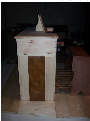
usazený a připojený hrací stůl s novým podiem