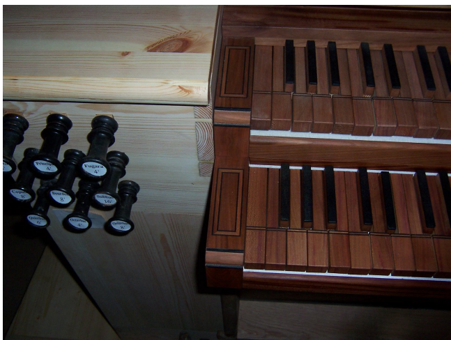
detailní pohled na bočnice klaviatur