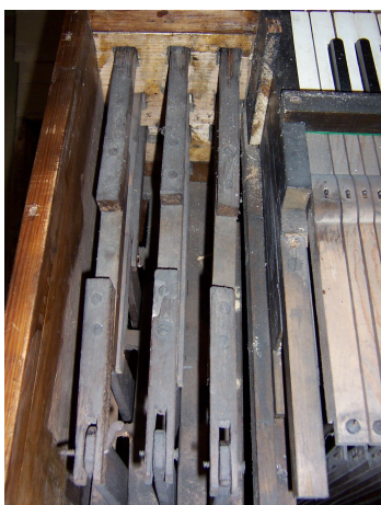
Přeřezaná a opět nastavovaná táhla