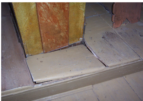
Detailní pohled na poškozenou podlahu stupně kryjícího trakturu

Stupeň byl zhotoven nový z masivního smrkového dřeva. Krycí vodorovná prkna byla zhotovena z typových podlahových palubek o tloušťce 40 mm. Celková výška stupně byla zachována na stejné úrovni. Podlahové palubky byly k sobě klíženy do bloků, které lze najednou demontovat a lze se snadno dostat na libovolném místě k traktuře. Spoje mezi bloky byly provedeny opět na falc. Podlaha byla preventivně konzervována a napuštěna olejem. Podlaha kůru pod podiem byla vyčištěna, umyta od skvrn po šelaku a prachu lihem, konzervována a napuštěna řídkým petrifikačním nátěrem solakrylu.