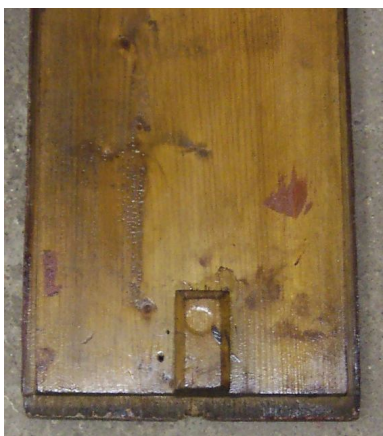
Uříznutý zámek výplně