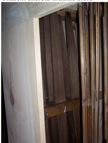
Propojení traktury v hracím stole