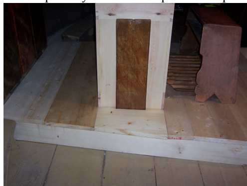
Podium po dokončení