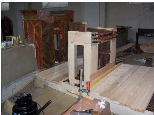
Průběh montáže podia