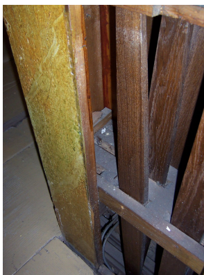
detail stolu - vlevo otvory po chybějících vahadlech