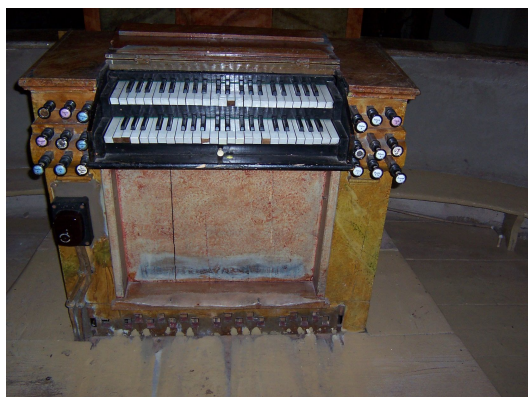
Celkový pohled na starý hrací stůl

Vnitřní technologie (táhla, abstrakty, vahadla, ložiska vahadel, úhelníkové lišty, manubria) byla restaurovaná, případně doplněna podle dochovaných původních vzorů a namontovaná do skeletu případně k podlaze kůru stejným způsobem jak bylo v příslušné době obvyklé.