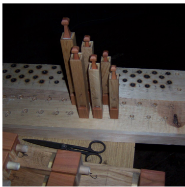
usazování Kopuly 4 e