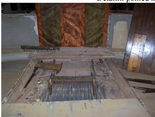
Po demontáži hracího stolu