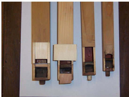
jednotlivé fáze vysazování