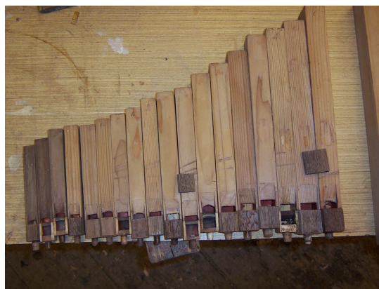
... po odstranění šelaku