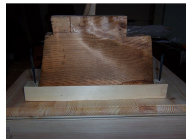
restaurované ložisko traktury s kovanými hřebíky