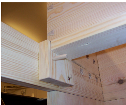
spoj pomocí stylových Lg hřebů