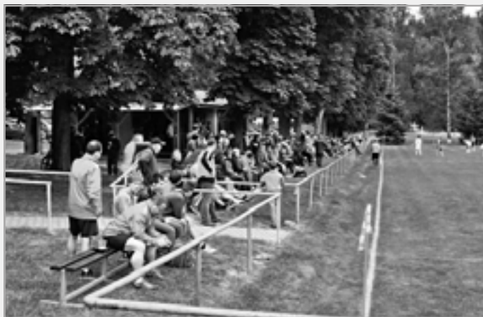
Finálový zápas poháru JUTAGRASS staršího dorostu sledovalo 170 spokojených diváků