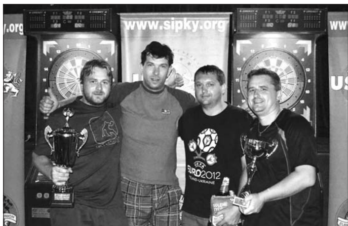
Premiérový start a hned titul, tak si počínal novopacký tým Kumburk v 8. ročníku Letního poháru.

Na závěr je na místě pogratulovat vítězům respektive všem medailistům. Avšak uznání a sympatie zaslouží i týmy, které nevyužily možnost posílit sestavu o jednoho hráče z nejvyšší áčkové kategorie (Extraligy respektive Superligy), a do soutěže se pustily v ligových sestavách. Takové byly letos pouze 2 celky jmenovitě Nové koně Velká Jesenice a domácí Pistolníci Dolní Kalná.