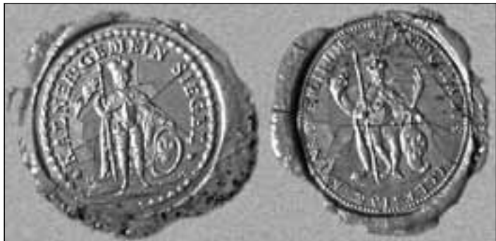
Pečeti Obce Dolní Kalná a farního kostela Sv. Václava

Hlavními barvami (řečí heraldiky řečeno tinkturami), zvolenými do návrhu znaku a praporu obce, jsou zelená – barva venkovské krajiny a červená – symbolizující červenou hlínu a barvu zakaleného potoka.