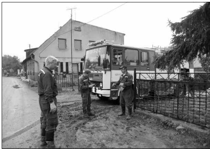
Naši hasiči se v obci Višňová na Frýdlantsku zúčastnili likvidace škod po letošních povodních