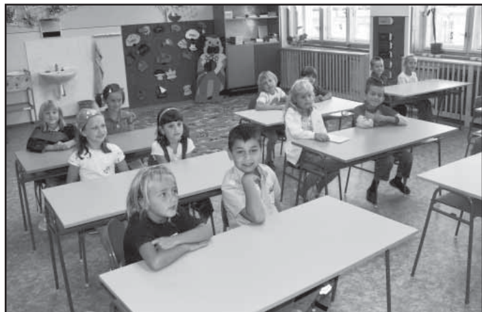
Prvníáčci, kteří svoji školní docházku zahájili 1. září 2009 v opravené a nově vymalované kalenské škole.