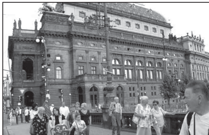
Na připojené fotografii je velmi dobře vidět spojení budovy Národního divadla s budovou Prozatímního divadla a dalším domem, tzv. Šulcovým. To bylo provedeno až při opravě po požáru v roce 1883. K tomu nutno ještě dodat, že k výročí 100 let Národního divadla byl v roce 1983 celý komplex rozšířen ještě o budovu Nové scény. To však na snímku není vidět a tvoří to další etapu historie Národního divadla.

Sbor i nadále pokračoval v úsilí o výstavbu reprezentativního českého národního divadla. Ze všech předložených návrhů byl nakonec vybrán projekt architekta Josefa Zítka. A tak 16. května 1868 mohla proběhnout celonárodní slavnost „kladění základních kamenů Národního divadla“. Tyto kameny byly do Prahy dopraveny slavnostně vyzdobenými vozy, vlaky, i loděmi ze všech významných koutů naší vlasti (Říp, Blaník, Radhošť, Vyšehrad, Boubín, Hostýn aj.), čímž se naplnilo heslo „Národ sobě“, které je vytesáno na jednom z nich a je též napsáno nad oponou. Jeho autorem je Karel Havlíček Borovský, který byl členem Sboru při jeho zakládání. Slavnostní poklepání na základní kámen provedl František Palacký, který byl prvním předsedou Sboru. Slavnosti se tehdy zúčastnilo více než 100 tisíc občanů, kteří celý obřad provázeli zpěvem českých národních písní.