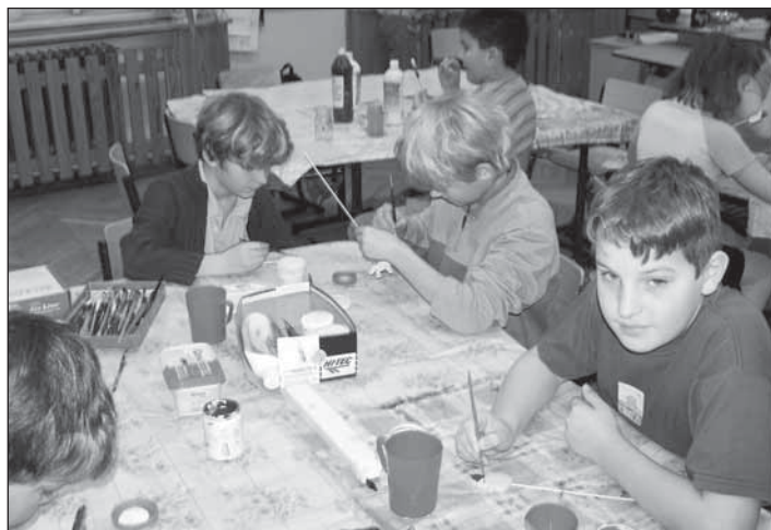
Žáci naší základní školy při „Vánočním tvoření“