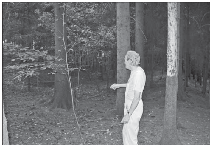
Fotografie z lesa proti Kunčicím, kde byl objeven dělostřelecký okop.