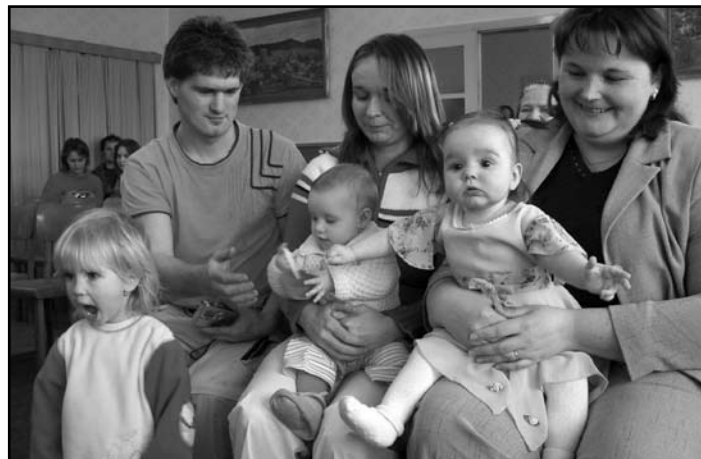
Šťastní rodiče za Slemena ...