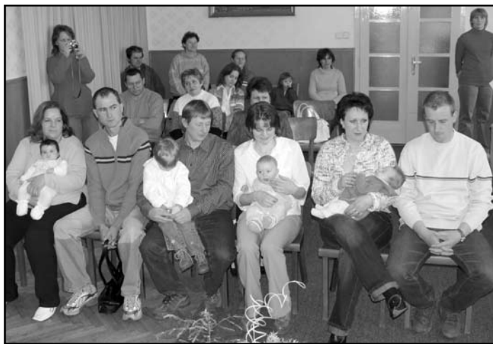
... a šťastní rodiče z Dolní Kalné