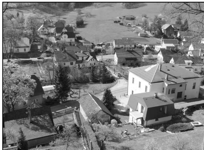
Pohled na Dolní Kalnou z věže kostela sv. Václava