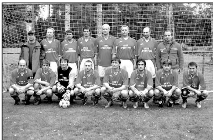
Hráči našeho „B“ mužstva v nových dresech, které zakoupila trutnovská firma INEX SPEDITION.