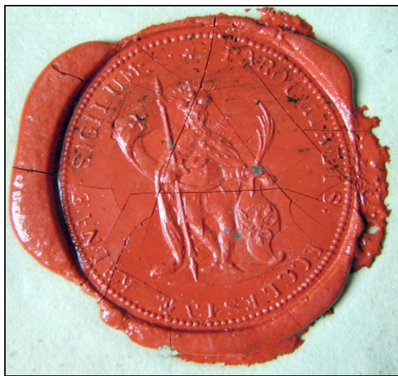
Historická pečeť farního kostela v Dolní Kalné

4. Nepřístupný; má letopočet 1779 a písmena: F. A. F.