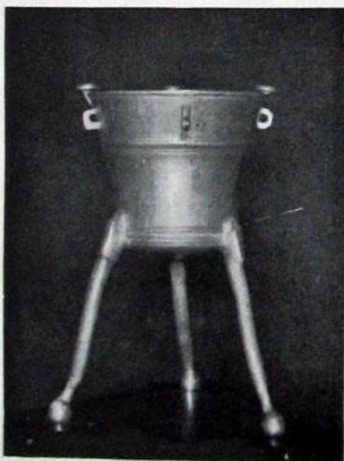
Obr. 87. Kalná Dolní. Křtitelnice ve farním kostele.

věnečkův ornamentálních. Empirová, z první poloviny XIX. století.