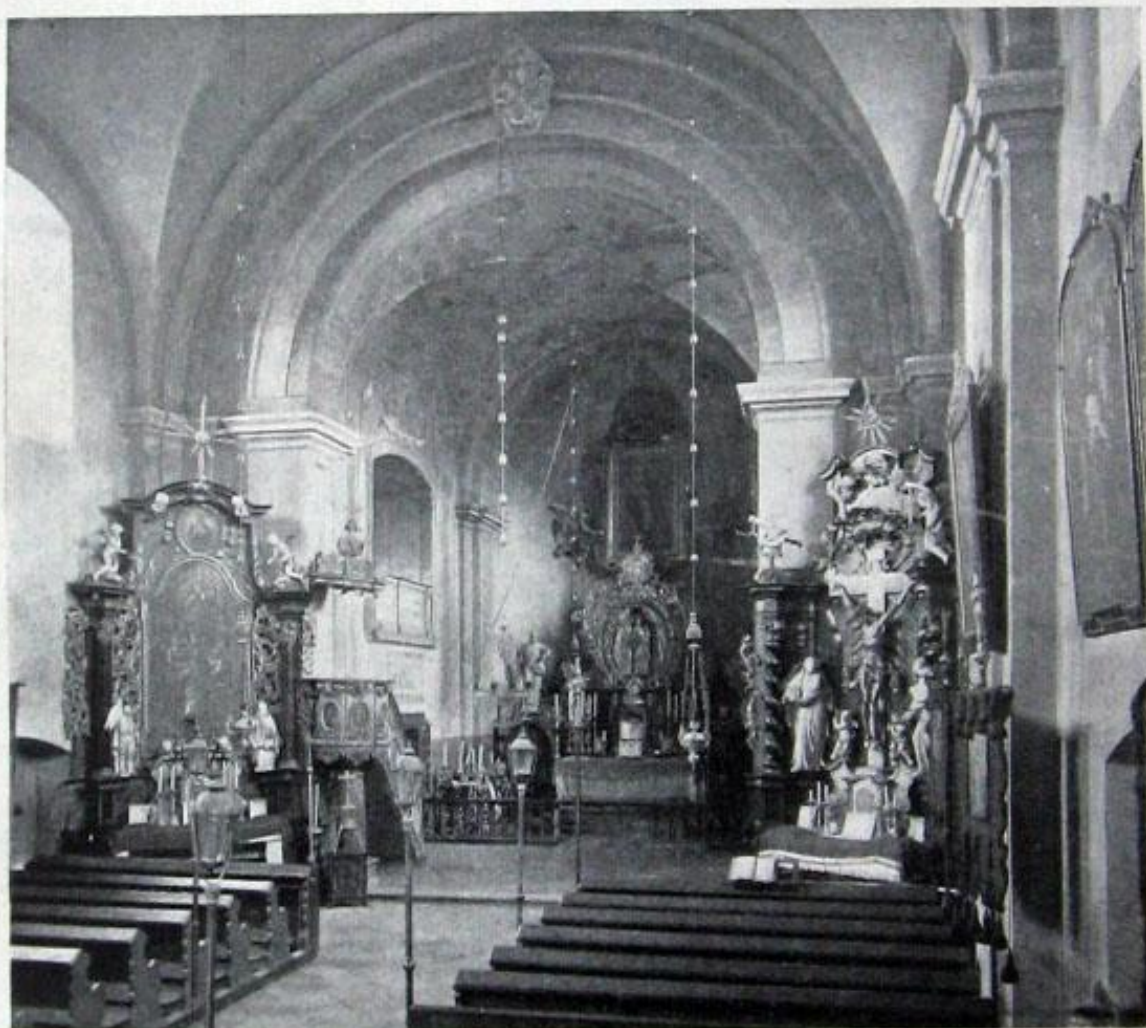
Obr. 84. Kalná Dolní. Vnitřek farního kostela.