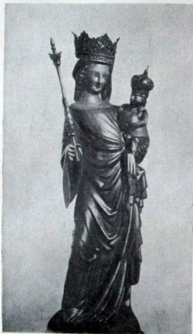
Obr. 85. Kalná Dolní, Soška P. Marie ve farním kostele.

O r a t o ř nad sakristií otvírá se do kněžiště segmentovým oknem.