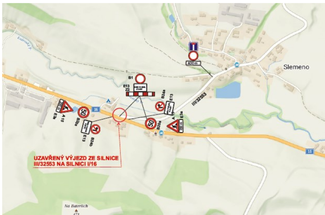
Stanovení DZ při napojení silnice III/32553 na silnici I/16