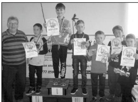
Účastníci Velikonočního šachového turnaje v kategorii 6 - 11 let.