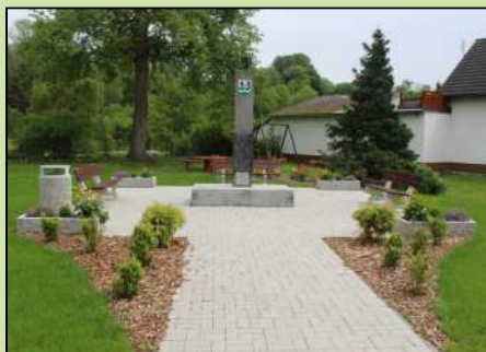
Opravený parčík v Dolním Lánově.