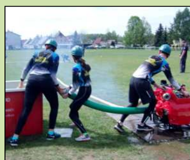
Okrsková soutěž SDH Horní Lánov.