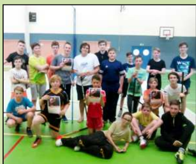
Miniturnaj ve florbale - Lánov.