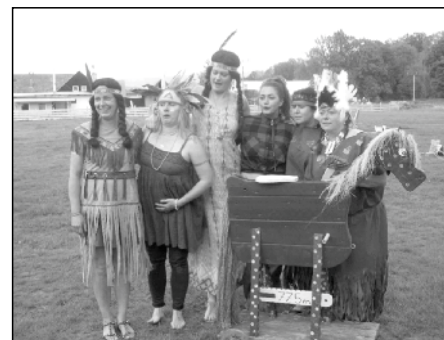
Indiánský organizační tým.

Po skončení nohejbalového turnaje patřilo celé sportovní hřiště dětem. Ve 14 hodin odstartovala indiánsko-kovbojská stezka. Učitelky ZŠ a MŠ spolu s ostatními zaměstnanci školy připravily úkoly, které děti plnily na sedmi stanovištích. Stezka končila na hřišti u školy, kde na děti čekalo zdolávání dalších, mnohdy netradičních, ale opravdu indiánských či kovbojských dovedností. Běh s kanoí, hod tomahavkem i oštěpem, střelba prakem na cíl, rýžování zlata, chůze po kládě s přenášením vody, zatloukání hřebíků a také střelba ze vzduchovky. U žádného stanoviště nechyběly sladké odměny. V dílničce si děti mohly navléknout korálky na kožený řemínek a vlastnoručně namalovat tričko. Kdo chtěl, dostal nafouknutý balóněk, a všechny děti dostaly zmrzlinu. Na závěr se všichni