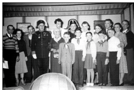
Ze hry Cizí role.