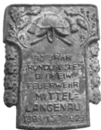
Slavnost 15. července k 30. výročí založení dobrovolných hasičů v Prostředním Lánově (1893 - 1923).