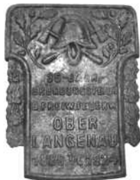
Slavnost 1. června k 35. výročí založení dobrovolných hasičů v Horním Lánově (1889 - 1924).