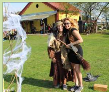
Čarodějnice v Dolním Lánově.