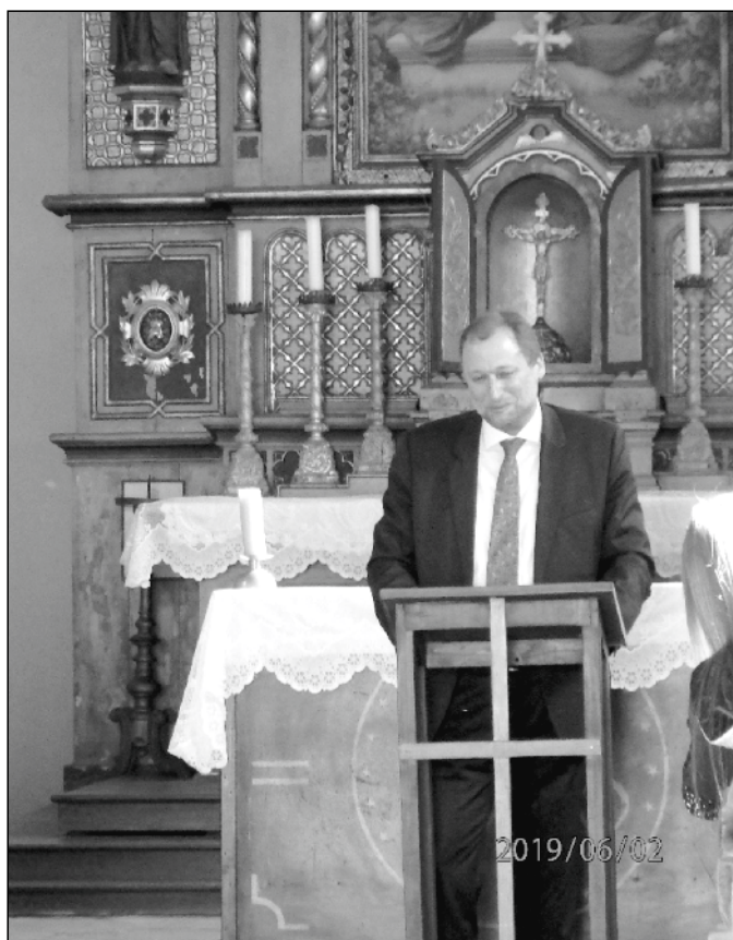
Opět nás navštívil velvyslanec ČR v Německu, pan Jan Podivínský.