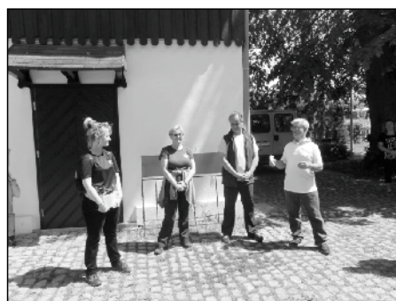
Před prohlídkou parku.