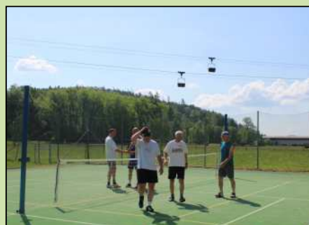
Nohejbalový turnaj v Dolním Lánově.