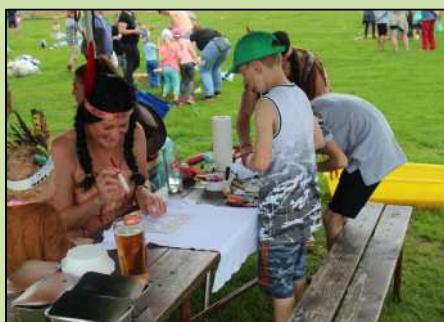
Dětský den v Dolním Lánově.