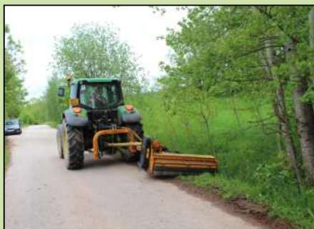
Údržba místních komunikací v Dolním Lánově.