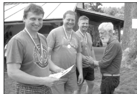
1. místo - družstvo CESTÁŘI.