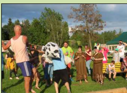
Dětský den v Dolním Lánově.