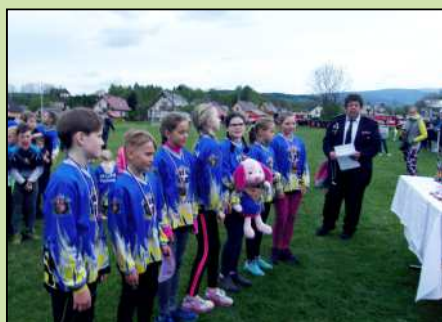
Okrsková soutěž SDH Horní Lánov.

Zpravodaj obce Lánov a sousedních obcí Dolní Lánov a Dolní Dvůr - periodický tisk územního samosprávného celku * Vychází čtyřikrát do roka * Redakce: Karolina Boková, Venkovské infocentrum mikroregionu, Prostřední Lánov 39, 543 41 Lánov, e-mail: infocentrum@lanov.cz, tel./fax: 499 432 083 * ev.č. MK ČR E 20472 * Vydává Obec Lánov, Prostřední Lánov 200, 543 41 Lánov, IČ: 00278041 * © Grafická úprava: Zdeněk Máslo ml.- Reklamy Lánov * * Korektura: Marta Hrušková * Datum uzávěrky Zpravodaje: 3. 1., 1. 3., 1. 6. a 1. 9. * * Léto 3/2019 * Náklad: 1050 ks * č. 50 * zdarma *