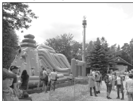
Zde slavily děti.