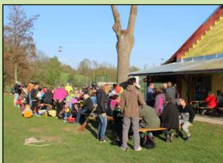
Čarodějnice v Dolním Lánově.