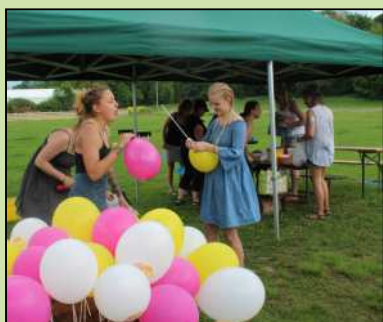
Dětský den v Dolním Lánově.