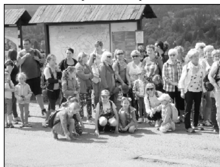
Příprava na prohlídku města.