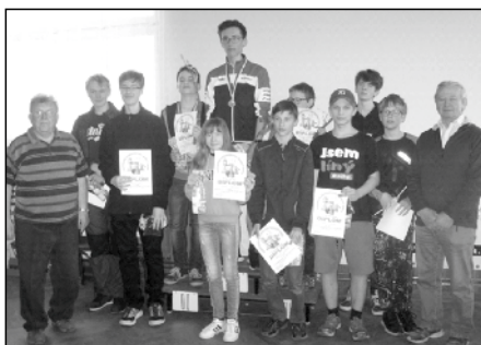
Účastníci Velikonočního šachového turnaje v kategorii 12 - 18 let.