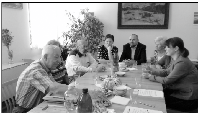
Přátelské setkání na úřadě.