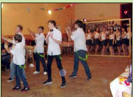
SDH Horní Lánov - mladi tančí...