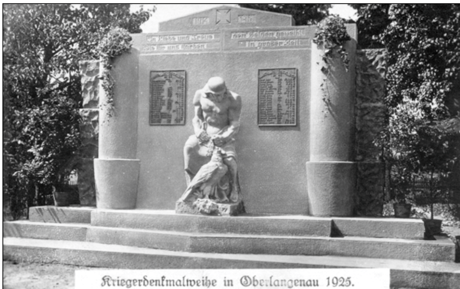
Takto kdysi vypadal pomník padlým v Horním Lánově.

Lánov má to štěstí, že se na jeho území nachází řada pěkných drobných sakrálních památek z minulosti. Obec vůbec asi poprvé ve své poválečné historii podniká první kroky k tomu, aby byly tyto křížky a také válečné pomníky zrestaurovány.