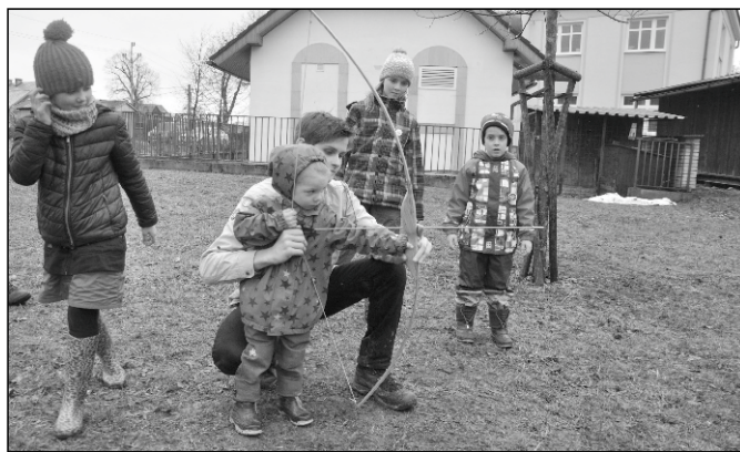
Střelení z luku.