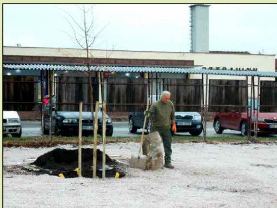
Strom republiky - lípa v centru obce.