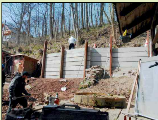
Opěrná stěna u místní komunikace.