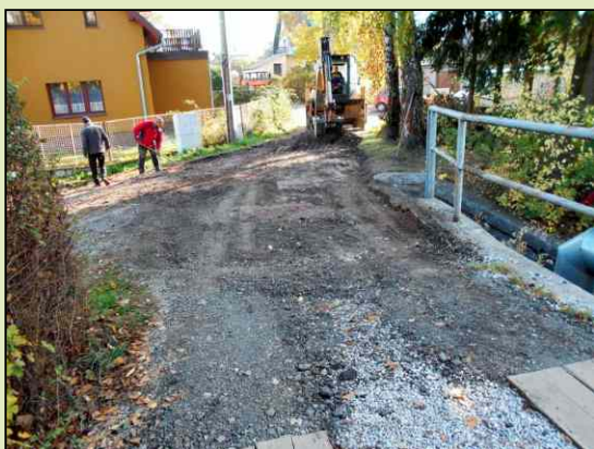
Příprava komunikace pro asfaltování.