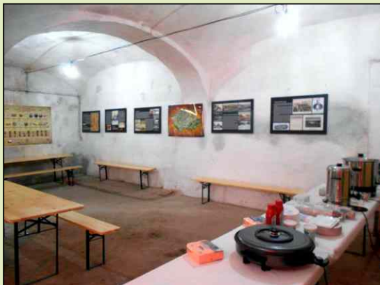
Výstava u příležitosti oslav 100 let od vzniku samostatného Československa.