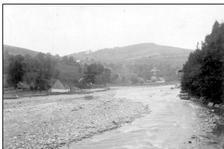
Hořejší Vrchlabí okolo r. 1900, po velké povodni.

z Morzinu, který dostal Vrchlabsko jako konfiskát darem od Ferdinanda II. Rudolf však byl zřejmě příliš vázán vojenskými povinnostmi, aby nějak zásadně zasáhl do dějin města. Otázkou je, jakým způsobem přežilo město hospodaření Švédů v letech 1639 – 48, když okolí tolik utrpělo (Jilemnice, Trutnov, Dvůr Králové). O Vrchlabí nemáme v tomto směru zprávy. Vyvozovat ze skutečnosti, že obyvatelé byli všichni evangelíci, a proto je Švédové ušetřili, by asi bylo zavádějící. Spíš město splnilo všechny finanční požadavky (např. výpalné), jež kladli muži chladného severu. Jisté je, že přes vypočítávané ztráty v okolí město během války a po ní mírně vzrostlo o 4 domy a 30 obyvatel.