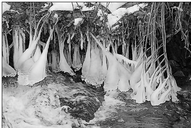
Ledy na Klínovém potoce.