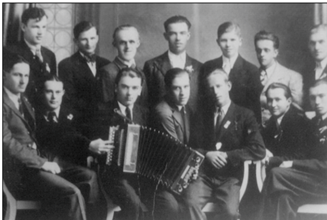
Můj otec - dole ve prostředku s tahací harmonikou se svými českými přáteli z Vrchlabí.

důchodu, respektive na odpočinek (do penze). Dlouhá léta si ale ke skromné penzi přivydělával. Obzvlášť rád pracoval na recepci hotelu, protože tu přišel do styku s mnoha lidmi. Díky jeho znalostem češtiny byl kvůli tlumočení také často na cestách. Složil tlumočnické zkoušky nejen z češtiny, ale také ze slovenštiny. Naposledy, kdy mu bylo už víc jak 80 let a byl slepý, jej požádala kriminální policie a přizvala ho k výsledku pasáka a české prostitutky. Výslech trval celou noc a otce neustálé překládání velmi vyčerpalo.