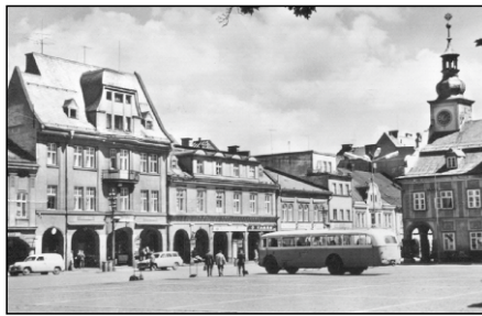
Náměstí ve Vrchlabí asi okolo r. 1970 (foto poskytla Věra Štemberová z Čisté).

a hodnotným životem v moderní společnosti. Chrám svou výbornou akustikou nyní slouží jako koncertní sál pro častá vystoupení profesionálních i amatérských souborů orchestrálních i pěveckých. Klášterní prostory jako hlavní