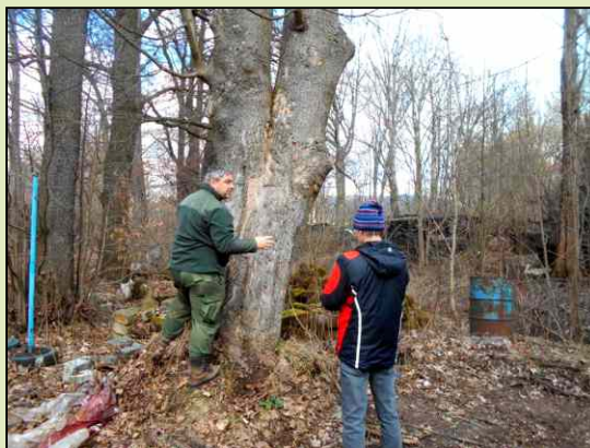
Obhlídka stromů obecním hajným.