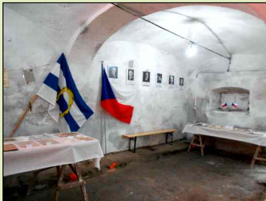
Výstava u příležitosti oslav 100 let od vzniku samostatného Československa.