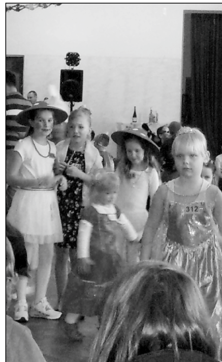
Karneval pro děti v Horním Lánově pořádaný hornolánovskými hasiči