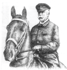
Obálka prvního dne vydání.