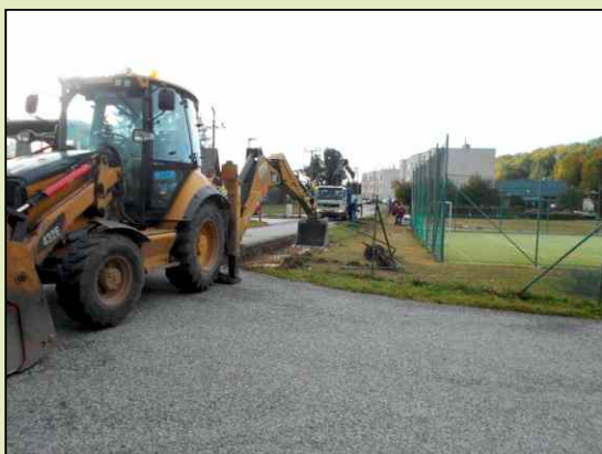
Práce na novém oplocení u ZŠ Lánov.