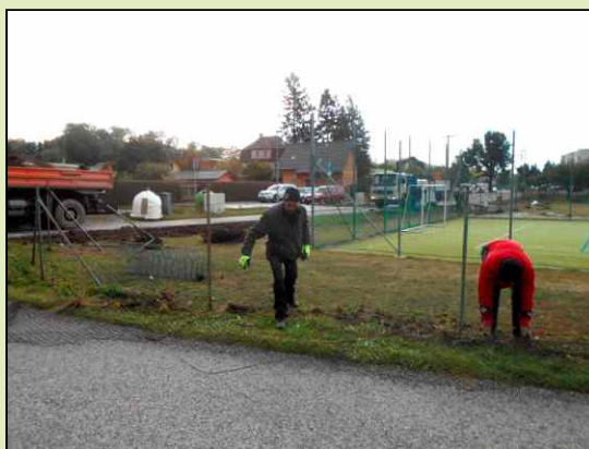
Odstranění starého plotu.