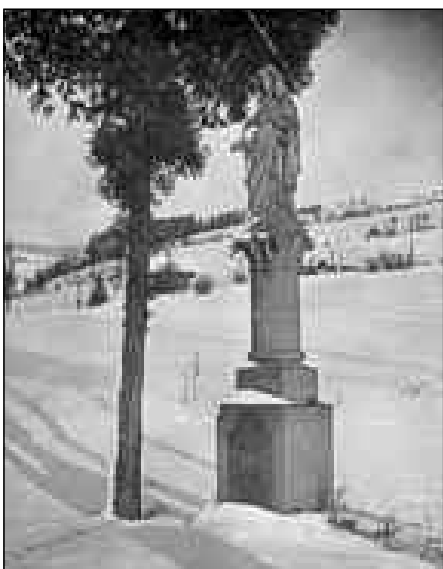
Takhle kdysi vypadal sloupek s madonkou v Prostředním Lánově u výjezdu na Čistou.

A tady se obracíme na Vás, vážení čtenáři, s prosbou o pomoc.