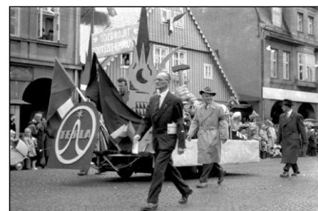
Jeden z mnoha průvodů ve Vrchlabí.

Po první světové válce a po vzniku Československé republiky dále sílí v místě český živel, pěstující rušný společenský život. České děti mají nejen obecnou školu, ale i měšťanskou. Sokol buduje svůj stánek nejen pro tělocvičnu. Aktivizuje se dělnické hnutí, zvláště v Hořejším Vrchlabí. To vše je trnem v oku místním henleinovcům. Ti v roce 1938 vítají odtržení pohraničí Hitlerovým Německem a zřízení Sudetengau.