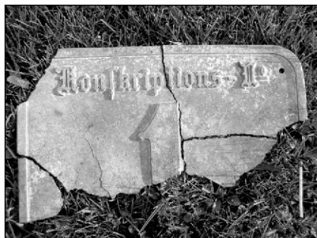
Číslo popisné 1 z fořteckého zámku.