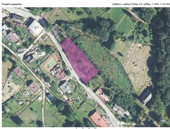
Lokalita 1(naproti obecní hospodě)