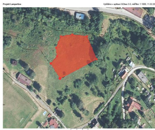
Lokalita 2 (bývalý lyžařský vlek)