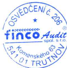
jednatel společnosti auditor ČR

Zpráva projednána s orgánem územního celku oprávněným jednat jeho jménem dne 18.05.2020.